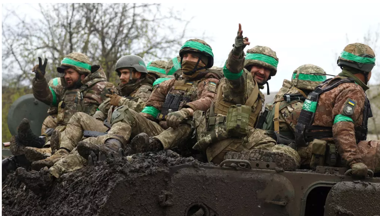
Ukrajínští vojáci se vrací z těžkých bojů u Bachmutu.

Ukrajina se hodlá obrátit na partnerské státy s žádostmi o extradici ukrajinských mužů v odvodovém věku, kteří se vědomě vyhnuli nástupu do armády a vycestovali ze země na základě padělaných dokumentů zprošťujících je povinnosti narukovat. Prohlásil to Davyd Arachamija, šéf parlamentní frakce největší vládní strany Služebník lidu. To by se mohlo týkat i Česka.