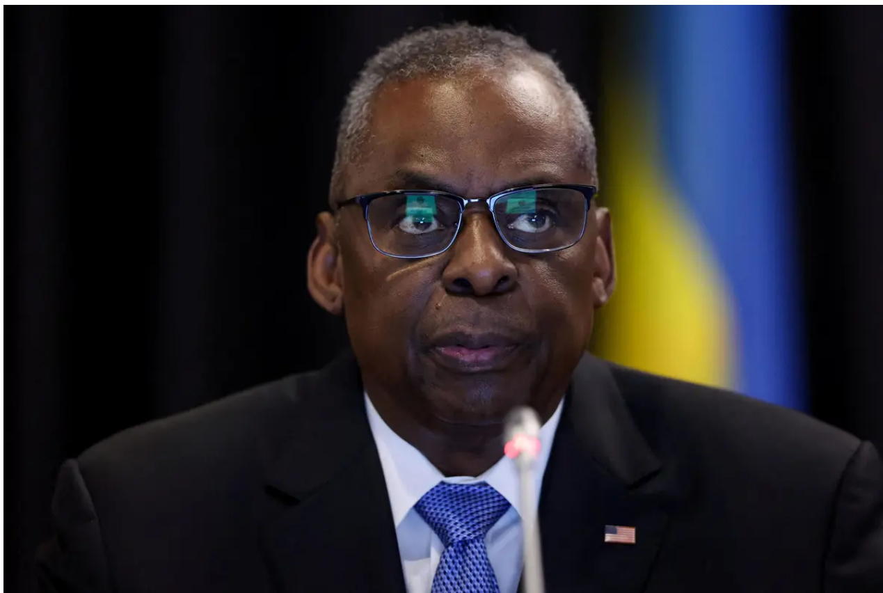
Americký ministr obrany Lloyd Austin