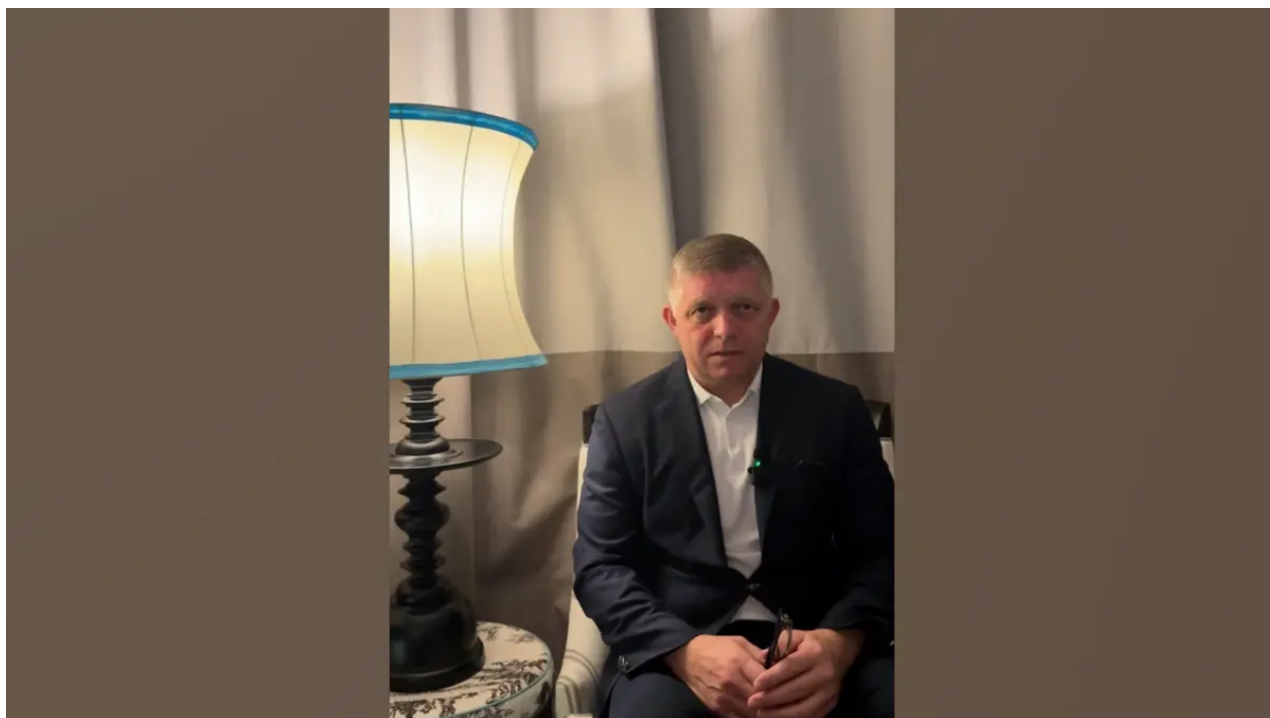
Fico ve videu pohrozil Ukrajině možným zastavením dodávek elektřiny Video: Robert Fico