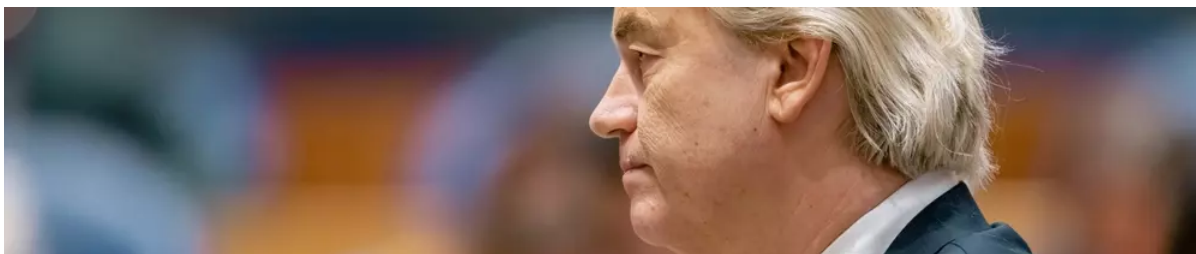
Geert Wilders.

Šedesátiletý Geert Wilders se narodil v roce 1963 ve městě Venlo nedaleko německých hranic, jeho otec byl ředitelem tiskárny.