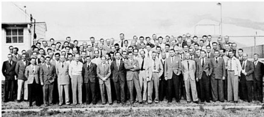
Tým Paperclip v Fort Bliss, Texas

Skočit na navigaci Skočit na vyhledávání