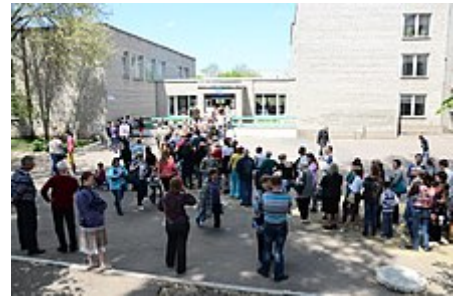
Lidé 11. května v Doněcku stojí ve frontě, aby mohli hlasovat v referendu o statusu doněcké oblasti