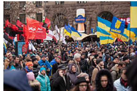
Lidé v Kyjevě podporující Euromajdan , 2. prosince 2013

Ukrajinská krize byla vlna nepokojů, skrytá ruská intervence a mezinárodní krize mezi Ukrajinou a Ruskem , která předcházela vypuknutí rusko-ukrajinské války roku 2014. Probíhala od listopadu 2013, kdy ukrajinský prezident Viktor Janukovyč nečekaně odmítl podepsat připravenou asociační dohodu s Evropskou unií , do léta 2014, kdy se ruské ozbrojené síly očividně zapojily do bojů.