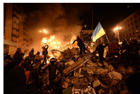
Protestující na Euromajdanu na barikádách bojují s ukrajinskou policií