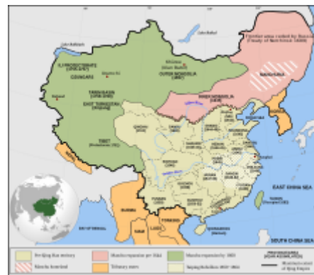
Expanze Číny do roku 1800 za vlády dynastie Čching

čínskou říši Ming z poloostrova Liao-tung . Roku 1644 armáda protimingského čínského povstalce Li C'-čchenga dobyla mingskou metropoli Peking. Wu San-kuej , velitel mingské armády bránící Velkou čínskou zeď proti Čchingům, se podrobil Čchingům a společně s nimi porazil povstalce. Severní Čínu Mandžuoové obsadili rychle, dobývání jižní Číny se protáhlo do roku 1683, kdy již panoval císař Kchang-si (vládl 1661–1722). Za císaře Čchien-lunga (vládl 1736–1796) v deseti velkých taženích čchinský stát rozšířil svá území v centrální Asii.