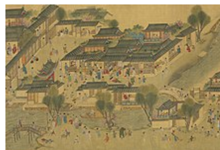
Čínské město z období dynastie Ming

včetně obnovení Velkého kanálu, Velké čínské zdi a výstavby