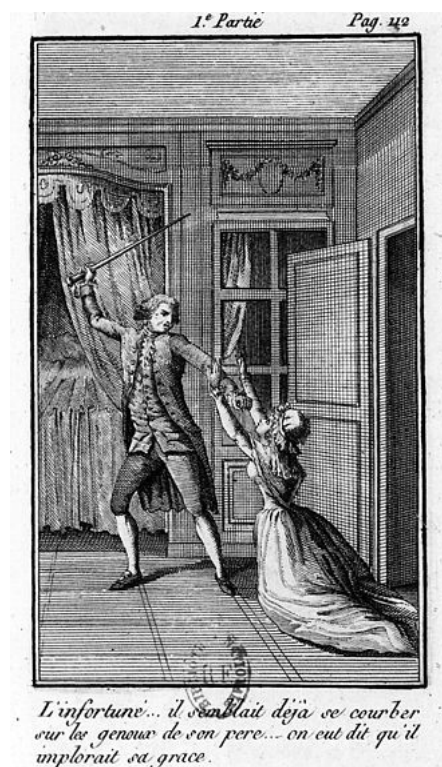
Ilustrace z knihy Aline a Valcour od Markýze de Sade (1795)