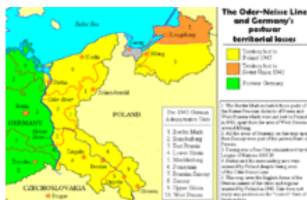
Územní ztráty Německa po druhé světové válce

Závěrečný akt Konference o bezpečnosti a spolupráci v Evropě ( anglicky Final Act of the Conference on Security and Cooperation in Europe , rusky Заключительный Акт Совещания по безопасности и сотрудничеству в Европе ) je výsledný dokument jednání Konference o bezpečnosti a spolupráci v Evropě (KBSE).