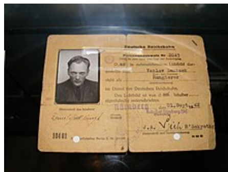
Pracovní průkaz zaměstnance Německých říšských drah v Norimberku