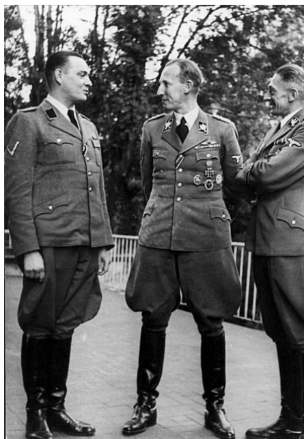
Heydrich (uprostřed) a K. H. Frank (napravo) v Praze

jedním z cílů agrární politiky NSDAP . Cílem nebylo jen hospodářské vykořisťování území protektorátu, ale cílená germanizace prostoru na základě osidlovací politiky prostřednictvím rolnictva – na pozadí kultu půdy ( Blut und Boden ) a vyživovacího hospodářství (doplněného rasovými teoriemi). [7]