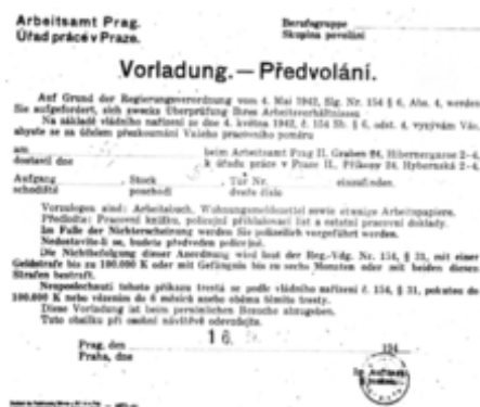
Předvolání na úřad práce