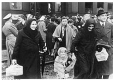
První "Volksdeutsche" z Besarábie dorazili do České Lípy 3.10. 1940