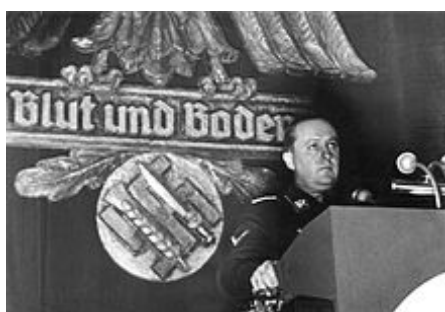
Walther Darré – Ministerstvo výživy