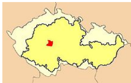
Výcvikový prostor jednotek SS