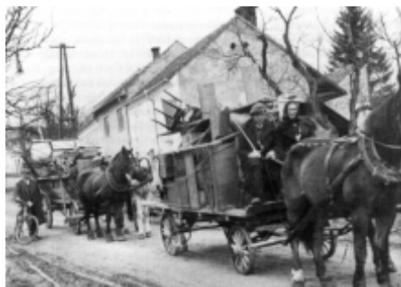
Obyvatelé Rychtářova opouštějí v březnu 1941 vesnici