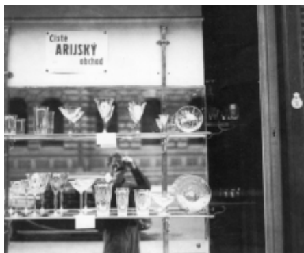
"Čistě arijský obchod", rasová politika v běžném životě