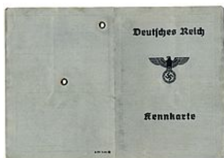
Kennkarta pro Třetí říši