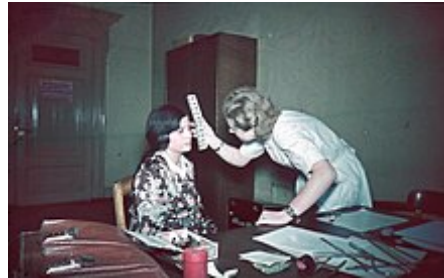
Určování barvy očí pro rasové účely