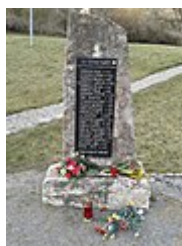
Pomník Obětem náletu 14. února 1945 v Praze – Košířích [14] [15]