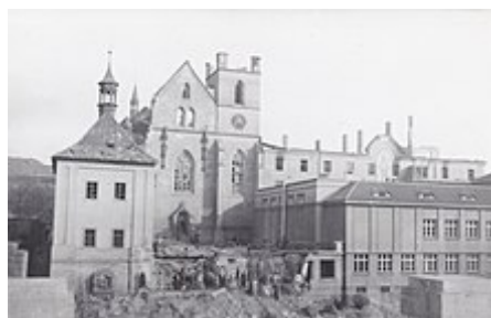
Emauzský klášter po náletu