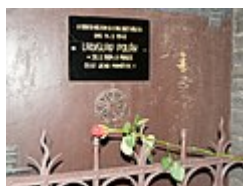
Pamětní deska v Apolinářské ulici