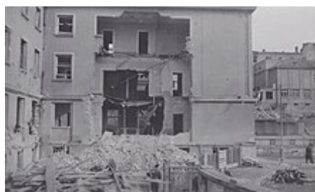
Emauzský klášter a bývalé Ministerstvo sociální péče po náletu

Některá data mohou pocházet z datové položky.