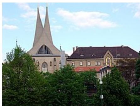
Obnovené věže Emauzského kláštera

Letecký útok na Prahu 14. února 1945 byla operace amerických vzdušných sil (USAAF). [1] Praha se během druhé světové války stala cílem spojeneckého bombardování několikrát, [2] ale nálet 14. února 1945 byl z nich co do počtů lidských obětí nejtragičtější. [3]