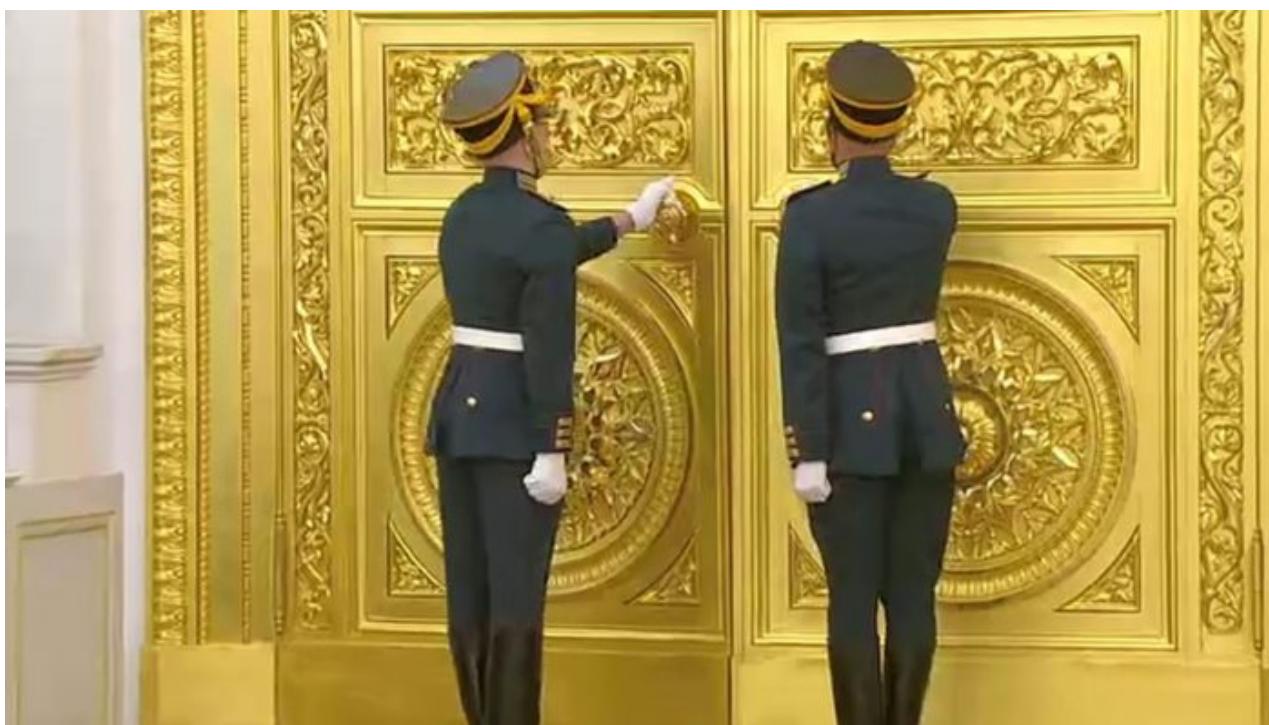
Zlaté dveře v sále Sv. Jiří v Kremlu, symbol majetku a moci Ruska

Chlapci jsou učeni nosit dívčí šaty jako Drag Queens a dívky zase opačně, aby se oblékaly jako chlapci. Současné jim školy říkají, že mají právo “ Pro-Choice ” ve smyslu práva volby změny pohlaví, aby souhlasilo s jejich převleky, takže chlapci po převlečení do dívčích šatů a dívky převlečené do chlapeckých šatů jsou učeni, že mají právo si nechat chirurgicky změnit pohlaví, když se cítí být opačným pohlavím. Když se to dozví rodiče, naběhnou do školy a spustí řev, ale škola upozorní policii, sociálku a děti jsou rodičům odebrány. Toto probíhá v USA, v Kanadě, ve Velké Británii, v Norsku a v mnoha dalších západních zemích. Rodiče již nesmí mít kontrolu nad sexuálním vývojem svých dětí.