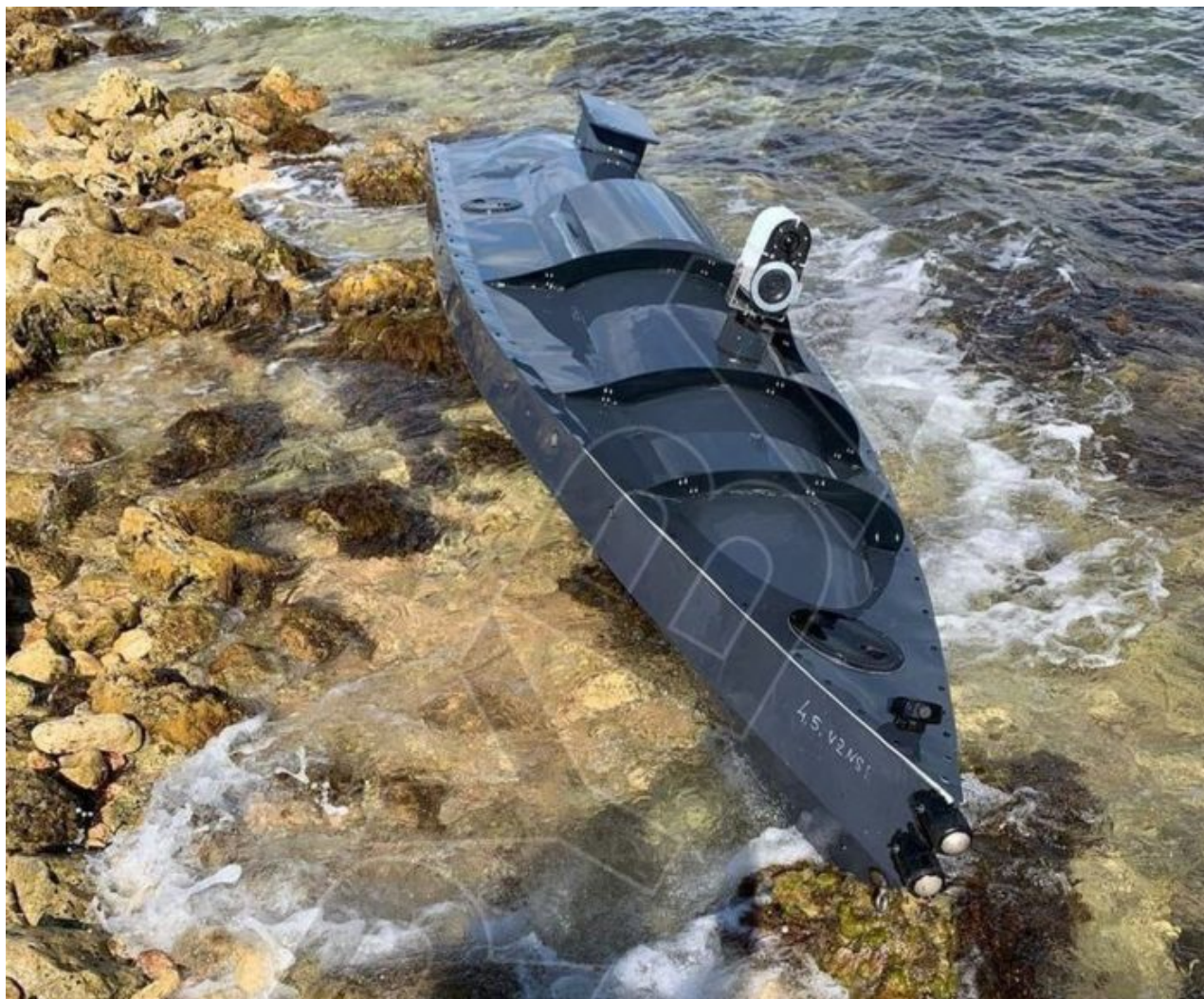
Vyplavený dron na pobřeží Sevastopolu

Teď si musíme vysvětlit, jak tyto informace vyhodnocovat a jak je konceptuálně zařadit do reálného obrazu. V sobotu odpoledne po útoku na most byl do funkce velitele speciální vojenské operace na Ukrajině dosazen Putinův generál ze Sýrie přezdívaný “generál Armageddon” Sergej Surovikin [3]. Svoji přezdívku získal svým stylem vedení bojových operací v Sýrii, kdy na velice slabé a malé cíle posílal nejtěžší možné zbraně a nejtěžší bomby, což generální štáb označoval za plýtvání zbraněmi.