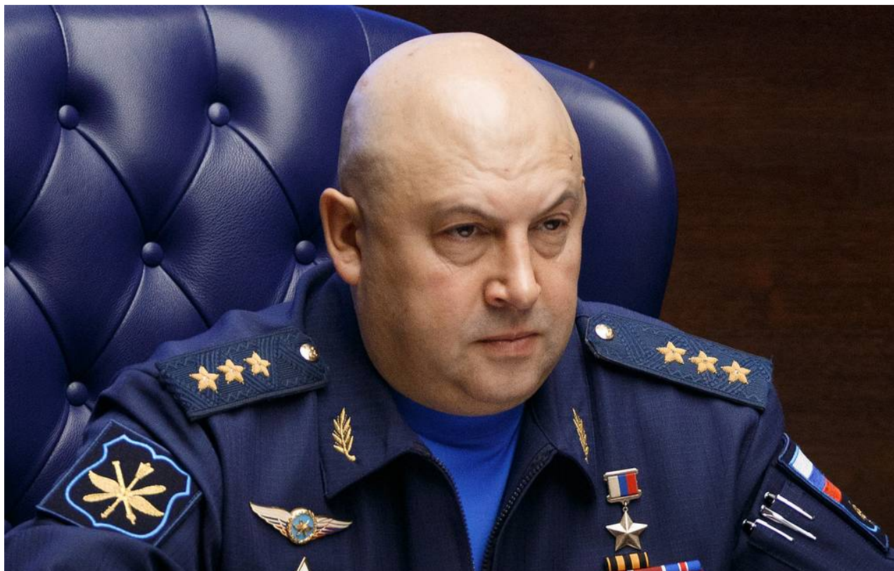
Generál Sergej Surovikin

Proto v konceptuální rovině je všechno opravdu mnohem složitější, než je rovina mediální. Mediální rovina totiž vždy zachycuje jen následek a důsledek nějakého procesu řízení, ale příčina je vždy schovaná v konceptuální rovině. Je to rovina otázky plánu, tedy otázky toho, co je třeba učinit, aby cíl plánu byl dosažen, jakkoliv cesta k cíli je šílená a postrádá smysl v mediální rovině.