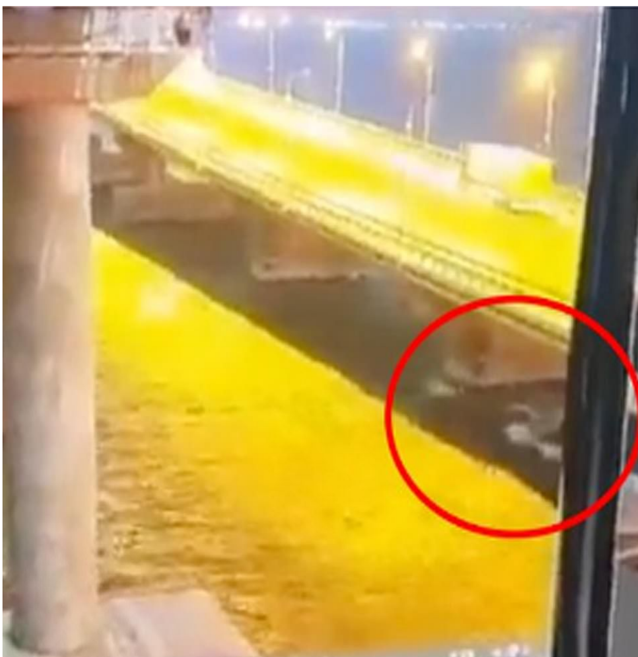
Kýlová vlna na hladině mořen pod mostem těsně před explozí

Žádné povrchové plavidlo, ani dron, se nemohl bez povšimnutí Ruského námořnictva dostat k mostu, a to ještě navíc za směru Azovského moře, které je dnes ze všech stran pod kontrolou Ruska. Rovněž si lidé na ruských sociálních sítích všimli, že v době útoku jel z nepochopitelných důvodů nákladní vlak s palivovými nádržemi po mostě doslova krokem, namísto normální rychlosti okolo 50 km/h.