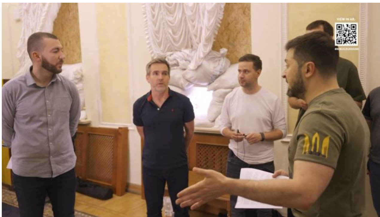
Zelenský se štábem britských technologů z TalesMith

Pokud někdo shání peníze pro Ukrajinu a pro válku, měl by cestovat po celém světě a hučet do politiků na osobních setkáních. Jenže, tohle se právě neděje. Zelenský všude, naprosto všude vystupuje jen přes telemost. Přes telemost mluví k Radě bezpečnosti OSN, kde obviňuje Rusko, že jejich vojáci z hladu žerou snad i malé ukrajinské děti, přes telemost mluví s předáky skupiny G7, že musí na Rusko uvalit další sankce, k českým poslancům mluví přes telemost o tom, jak je potřeba pomáhat Ukrajině více a více zbraněmi.