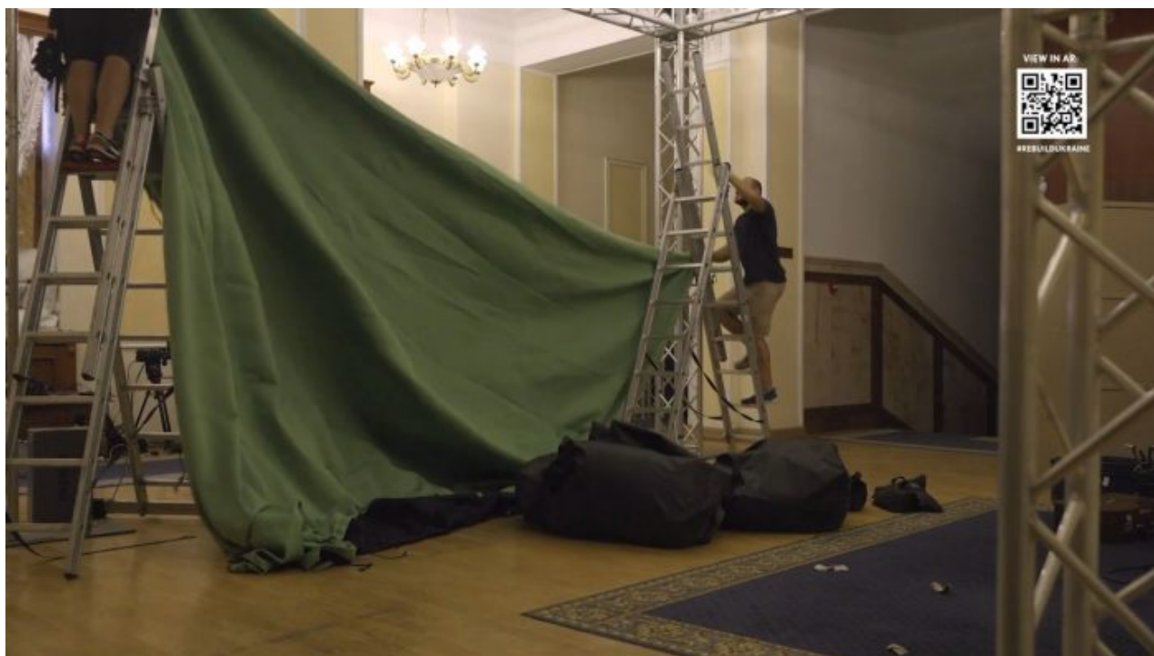
Příprava studia v prezidentském paláci v Kyjevě

Všichni se ptají, proč se Zelenský účastní mezinárodních konferencí a jednání pokaždé a vždy jenom dálkově pomocí telemostu? Válka na Ukrajině trvá již 8 měsíců a během té doby se Zelenský ještě ani jednou neodvážil vystrčit hlavu z Ukrajiny a odjet či odletět na mezinárodní konferenci. Zelenský se všech konferencí na Západě neustále účastní jen virtuálně a na dálku pomocí telekonferencí Skype.