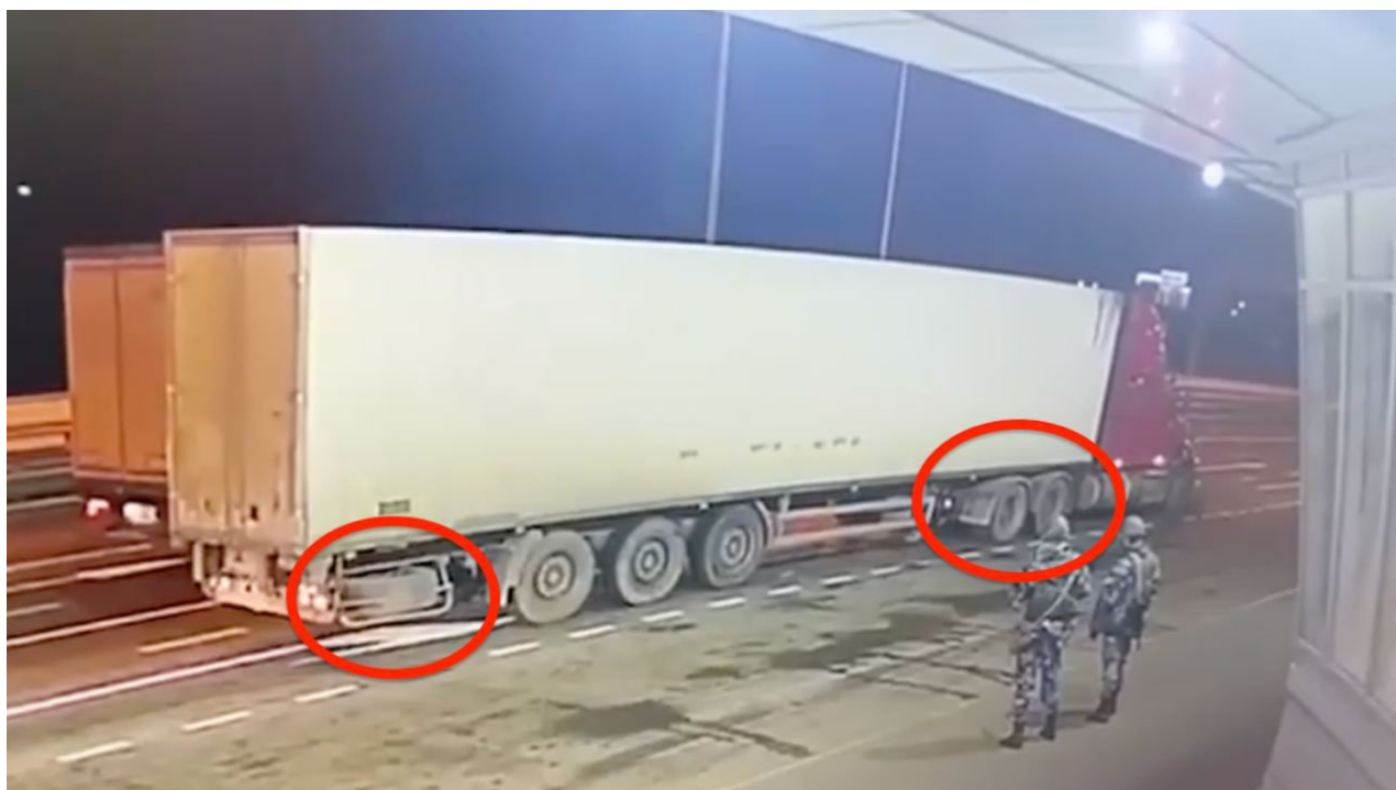
Americký kamion na strážnici u vjezdu na Krymský most

Ukrajinci za většinou raketových útoků nestojí, střelbu a navádění obstarávají vojáci zemí NATO. Některé exploze v Belgorodu a na Krymu pochopitelně jsou dílem Ukrajinců a ukrajinské armády, ale podle všeho to vypadá, že jenom drtivá menšina. Drtivou většinu úderů provádí američtí a britští vojáci, kteří komunikují s americkými AVACS letadly, které navádí palbu na ruské cíle na Krymu. S tímto nemá Ukrajina a ukrajinští vojáci už od května nic společného. Jakmile byly dodány na Ukrajinu americké systémy HIMARS a další těžká technika z USA, u těchto zbraní a při jejich obsluze začala ruská elektronická rozvědka registrovat jenom a pouze angličtinu.