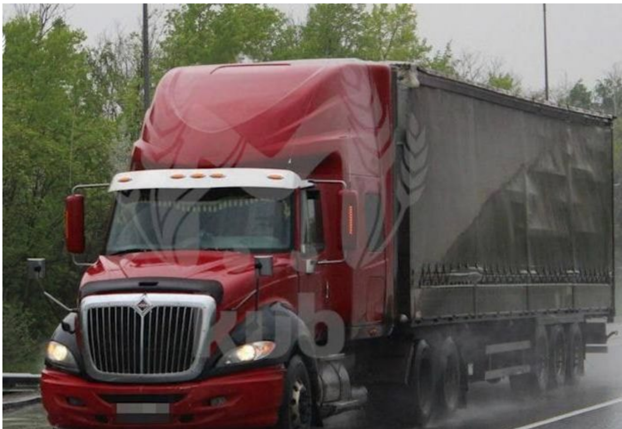
Fotografie amerického kamionu International Truck RH Series vyfocený v Krasnodaru na cestě na Krymský most