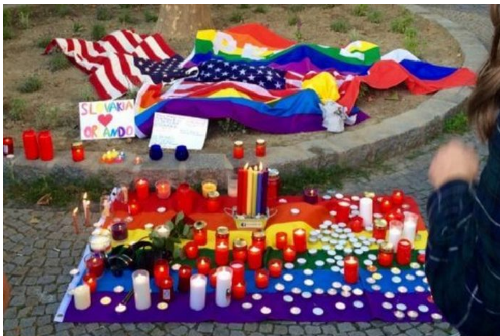
Sociální sítě zaplavily fotky pietních míst, zde dokonce z USA z Orlanda

podnícena ze zahraničí, včetně plánování. Jednalo by se tak o mezinárodní strukturu, kterou by bylo možné vykreslit jako bezpečnostní hrozbu, když osoby z ciziny působí na syna slovenského politika, který je kandidátem vlastenecké strany, aby páchal terorismus.