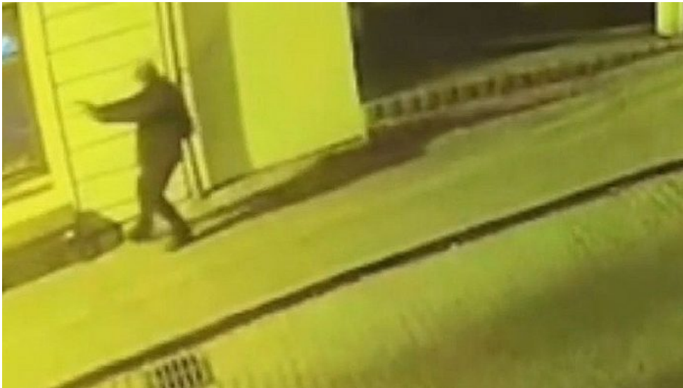
Záběr střelce z bezpečnostní kamery na Zámecké ulici v Bratislavě, kde se klub Teplárna nachází

blokovány všechny weby na Slovensku, které někdo označí za zdroje šířící potenciálně radikalizační materiály. A aby bylo zabráněno radikalizaci, jako to potkalo Juraje K. ve středu, tak budou ty weby zablokovány. A neskončí to jenom u webů.