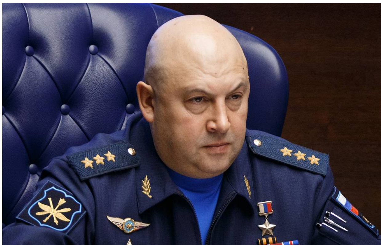
Gen. Sergej Surovikin, velitel SVO na Ukrajině

Surovikin totiž na konec proslovu prohlásil podivnou věc, že vyloučena nejsou ani těžká rozhodnutí, z čehož Rusové na sociálních sítích okamžitě pochopili, že měl na mysli právě stažení z Chersonu podobně, jako došlo ke stažení v Charkovské oblasti z Izjumu, Kupjansku a dalších měst. Jak to doopravdy Surovikin myslel s tím těžkým rozhodováním je ale do značné míry subjektivní podle toho, kdo tento výrok zrovna slyšel a koho se ptáte. Každý Rus si pod tím vyložil něco jiného.