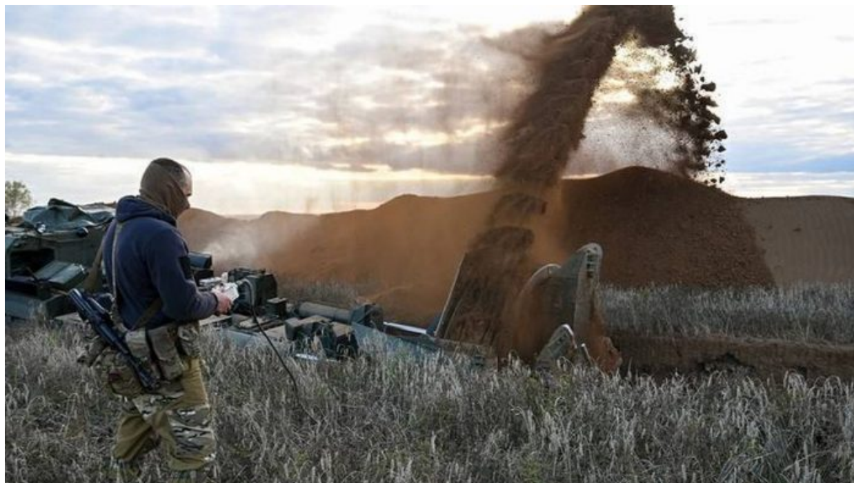
Ruský exkavátor pro strojové ražení zákopů a protitankových linií

příležitosti ospravedlnit své metody ze Sýrie a pošle na Kyjev bomby a bude to sypat v kobercích na vládní budovy v Kyjevě a na cokoliv, co se bude hýbat a bude mít designaci příslušnosti ke kyjevské juntě.