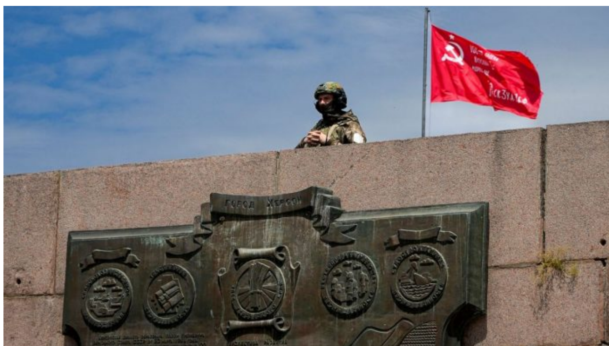
Střecha radnice v Chersonu, odkud se Ruská armáda musela stáhnout kvůli selhání koncepce 4. vrstvy Gerasimovovy doktríny

Ruská armáda je restrukturalizována a jejím úkolem je pouze obsluha těžkých zbraní z týlu a následná “peresila” uvolněných území, ze kterých byl vytlačen nepřítel. Zákeřnost této doktríny spočívá v tom, že území obsazuje armáda, jejíž vojáci nikdy neprojdou bojem fronty. To představuje do budoucna problém. Pokud totiž by teoreticky nastala protiofenzíva, potom “peresila” nemusí mít sílu území udržet, pokud nedisponuje početní a faktickou převahou a dobrým opevněním.