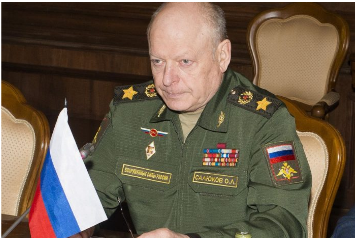
Velitel ruských pozemních sil gen. Oleg Saljukov, zástupce velitele SVO na Ukrajině

Ti se zúčastňují těch nejtvrdějších bojů společně s oddíly PMC Wagner Group a jsou nasazováni do útočných operací přímo na čele fronty. Tahle taktika vyháází z tzv. Gerasimovovy doktríny, kterou si musíme trochu popsat a vysvětlit. Valerij Gerasimov jako náčelník generálního štábu již před více jak 15 lety sepsal úplně novou doktrínu Ruské armády, která by se dala popsat jako hybridní válečná doktrína.