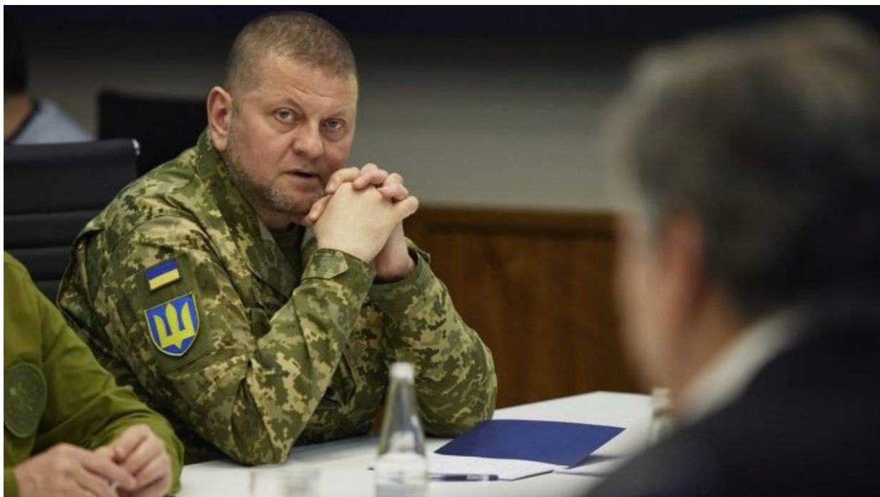
Valerij Zalužnyj, vrchní velitel Ukrajinských ozbrojených sil

System peresily v Gerasimovově doktríně by totiž nefungoval a slojka se ukázala jako výhodná koncepce, ale poměrně nebezpečná, pokud není dotažena do dokonalosti. Slojka selhala nejen v Charkově, ale i v Chersonu, kde prostě Ruská armáda neměla dost vojáků na peresilu, tedy na udržení předtím a těžce vybojovaného Chersonu. Z těchto chyb se musí Ruská armáda poučit. Stejně jako neměla muže na udržení ještě obtížněji vybojovaného Izjumu v Charkovské oblasti. Přesun velení SVO do rukou náčelníka generálního štábu Ruské armády Valerije Gerasimova tak předznamenává brzké spuštění Rusko-Běloruské operace. Cílem na nejbližší období je vytlačení Ukrajinců z celého území DLR a malého zbytku LLR. K tomu je ale potřeba oslabit ukrajinský kontingent a donutit Kyjev, aby ho přesunul jinam. Tím donucením bude ofenzíva z Běloruska.