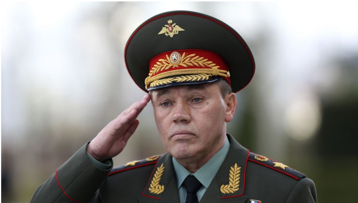
Gen. Valerij Gerasimov, náčelník generálního štábu Ruské armády a vrchní velitel SVO na Ukrajině

Organizace Jevgenije Prigožina, Ramzana Kadyrova a opolčenecké jednotky dobrovolníků DLR a LLR. Veškerá dobytá města a území dobyly tyto 4 subjekty, z nichž ani jeden nespadá pod Ruskou armádu! Dokonce i v těchto okamžicích obkličuje Bachmut soukromá armáda PMC Wagner Group, která prostupuje ruinami města po dělostřelecké přípravě Ruské armády vzdálené daleko v týlu cca. 10 až 15 kilometrů od Bachmutu a frontové linie.