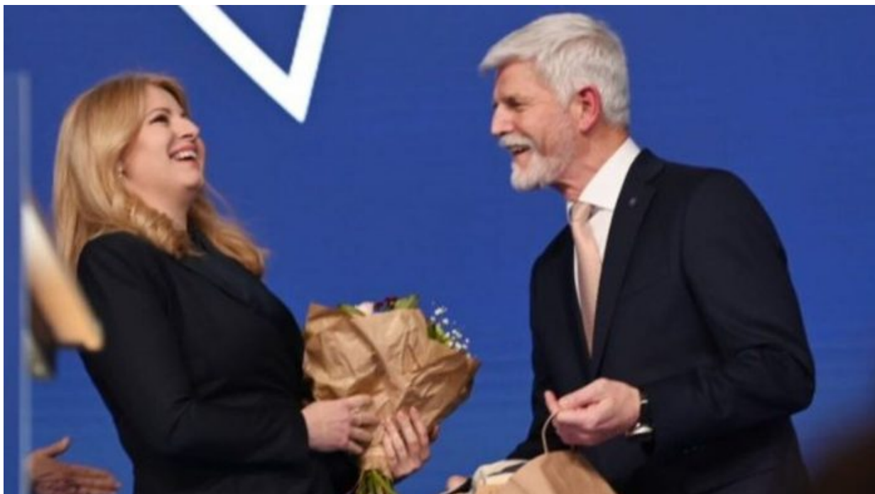
Zuzana Čaputová narychlo přijela do Prahy osobně pográtulovat Petru Pavlovi

Mají nyní pod kontrolou prezidenta, stejně jako na Slovensku. A brzy budou mít pod kontrolou i český Ústavní soud, stejně jako na Slovensku. Petr Pavel totiž bude jako prezident již brzy jmenovat předsedu českého Ústavního soudu, protože Pavlu Rychetskému končí mandát. A představte si, že právě Pavel Rychetský v sobotu poblahopřál Pavlovi k vítězství ve volbách slovy, že jeho výhru považuje za vítězství lásky a pravdy nad lží a nenávisť [1].