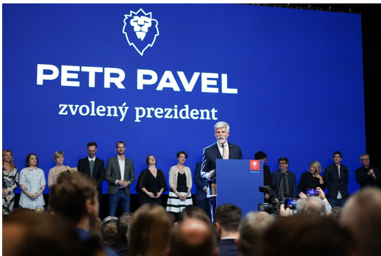
Vítězný projev Petra Pavla

Výsledek voleb není překvapivý, ale souvislosti a dopady volby jsou naprosto zásadní. Tento výsledek voleb totiž potvrzuje, že Česká republika je po 34 letech od roku 1989 definitivně transformována do neoliberální společnosti pod kontrolou trans-atlantických struktur procesů řízení a původní tradiční české střeoevropské řízení je definitivně odstraněno. Ve společnosti toto staré řízení tvoří již zcela zjevně menšinu voličů.