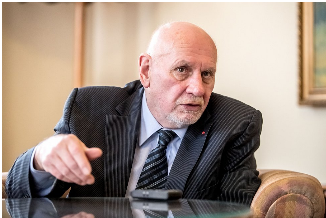
Pavel Rychetský, předseda Ústavního soudu

Původně každá strana v koalici musela ve volbách získat 5% hlasů, aby se dostala do sněmovny. Takže dvoukoalice potřebovala 10% hlasů u voleb, trojkoalice 15% pro vstup atd. Rychetského ústavní soud to však změnil a nově už dolní limita pro strany koalice neexistuje a platí namísto toho výsledná výstupní limita. Dvojkoalice potřebuje 7% hlasů pro vstup do sněmovny, trojkoalice 9% hlasů atd. Jinými slovy, Rychetského družina na Ústavním soudu změnila v ČR volební mapu.