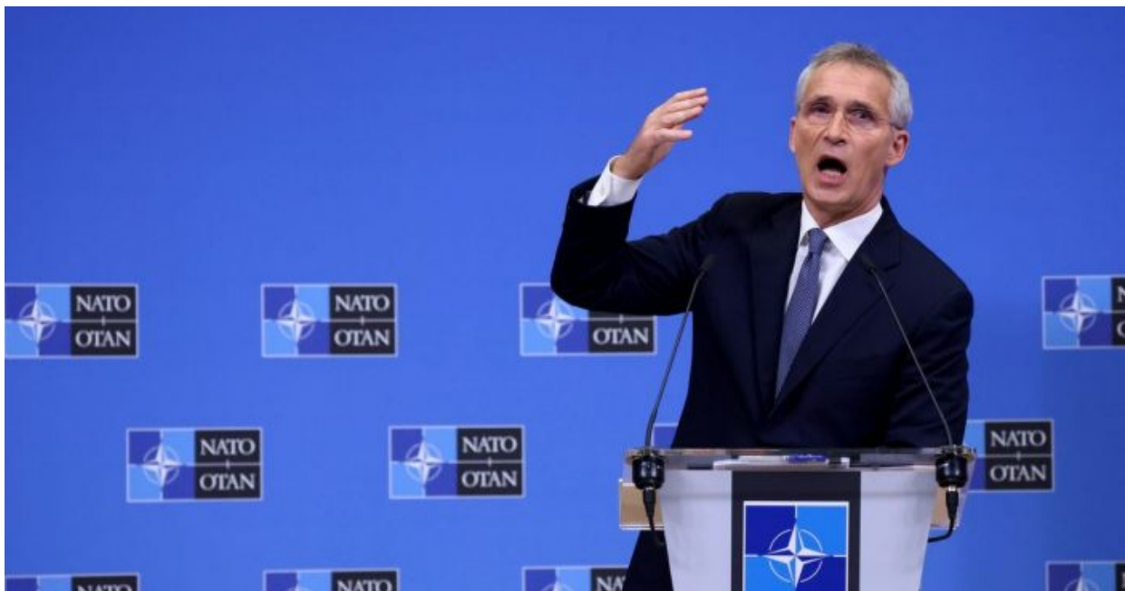
Válečný štváč, šéf NATO, Jens Stoltenberg

Čili model vojenské pomoci zemí NATO bez oficiálního požehnání NATO. Washingtonská smlouva totiž takovou unilaterální pomoc nezakazuje, takže Bezpečnostní rada NATO nemusí dát povel k alianční pomoci, ale může vyslovit doporučení, že každá alianční země může sama dobrovolně se rozhodnout, jakou formou pomůže Ukrajině.