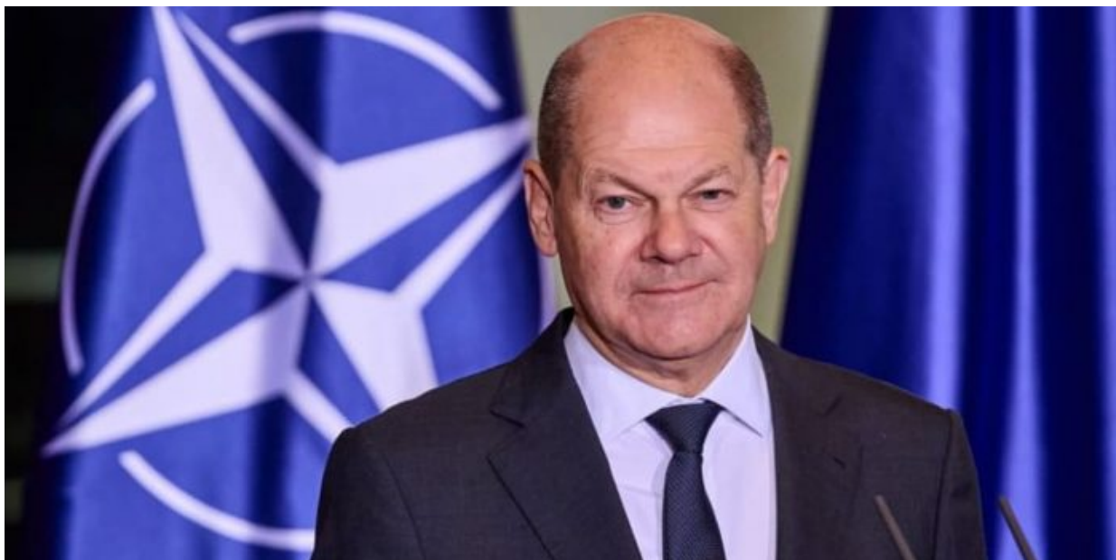
Olaf Scholz, německý kancléř

Zatímco Rusko bojuje s prostředníkem, USA se bojí porážky od Ruské federace a drží se vzadu. Američané totiž od konce II. sv. války neporazily ani jednoho rovnocenného nepřítele, a dokonce prohráli několik válek s mnohem slabším asymetrickým nepřítelem, naposledy v Afghánistánu, odkud Američané odešli po 20 letech neúspěšného válečného tažení.