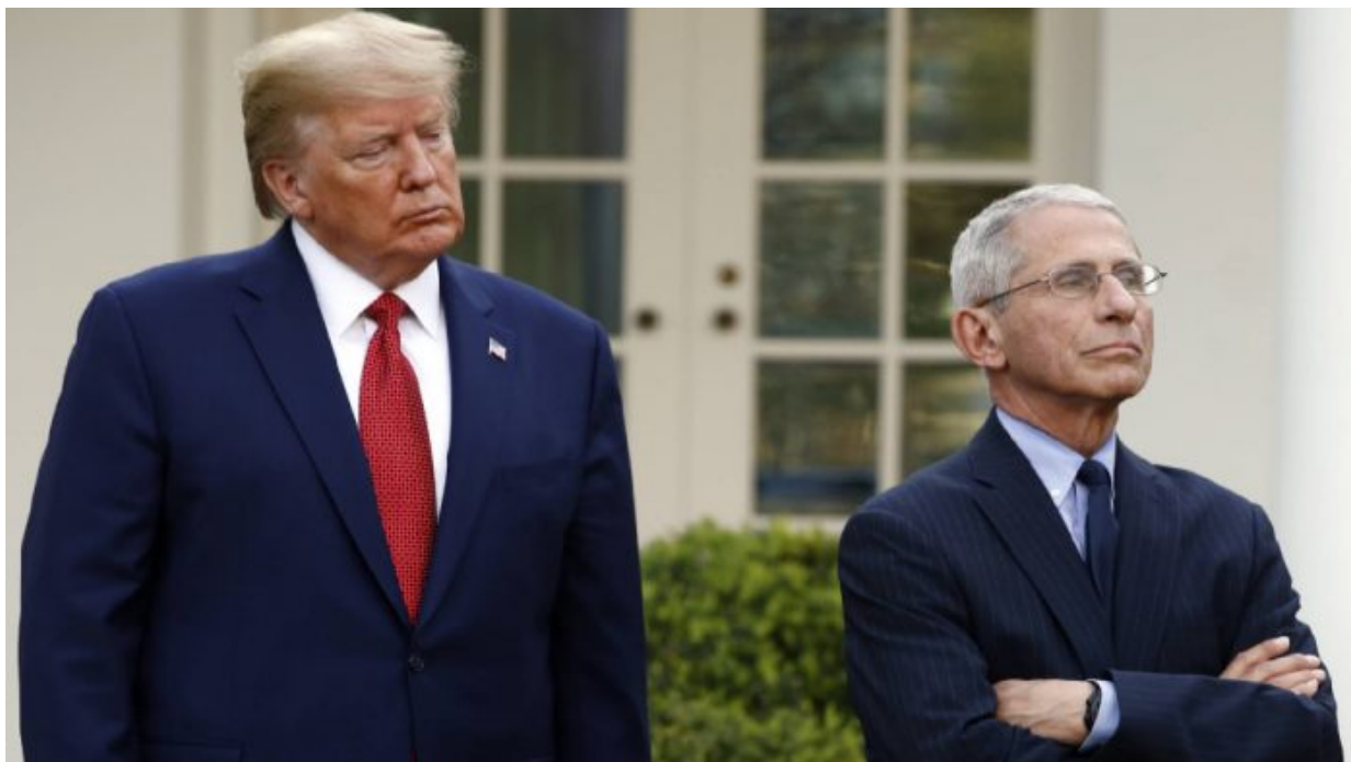
Donald Trump a Anthony Fauci před Bílým domem.

Veškeré očkovací látky, které mají původ v západních laboratořích, mají původ v amerických patentech a postupech. Nechat si dobrovolně do těla vpíchnout roztok z myší, ze psů, nebo z opic, které obsahují prudce nakažlivé viry způsobující rakovinu, je znakem šílenství a genocidy obyvatelstva. Právě proto ortodoxní Židé mají zákaz očkování svých dětí, stejně tak zákaz mimo-rodinných transfúzí, od cizích lidí. Charedim v New Yorku i v Izraeli mají své vlastní rodinné krevní banky, s vlastními zásobami krve a plazmy, aby nemuseli v případě potřeby vystavovat sebe nebo své děti kontaminaci lidí s krví nakaženou vakcínami z Fort Detrick, které jsou vyrobeny za použití bojových a prudce nakažlivých virů. Když farmaceutická lobby zničí kariéru molekulární biologice za to, že odhalí pravdu, tak doufám že chápete, čeho všeho jsou schopni a co udělají pro to, aby se pravda nedostala na světlo.