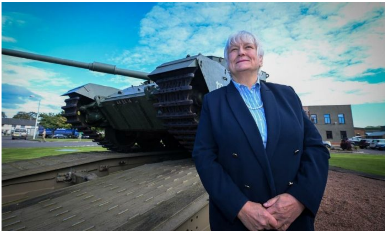
Náměstkyně ministra obrany Annabel Goldie

Moskva je tlačena do kouta s cílem, aby došlo k vypuknutí otevřené války mezi Ruskem a NATO. Usilují o to Londýnské kanceláře, které chtějí rozpoutat v Evropě III. světovou válku a provést majetkový a ekonomický reset, přičemž v této válce má být Rusko konečně a na 4. pokus poraženo, dobyto a jeho majetky a nerostné bohatství má být privatizováno právě Londýnskými kanceláři.