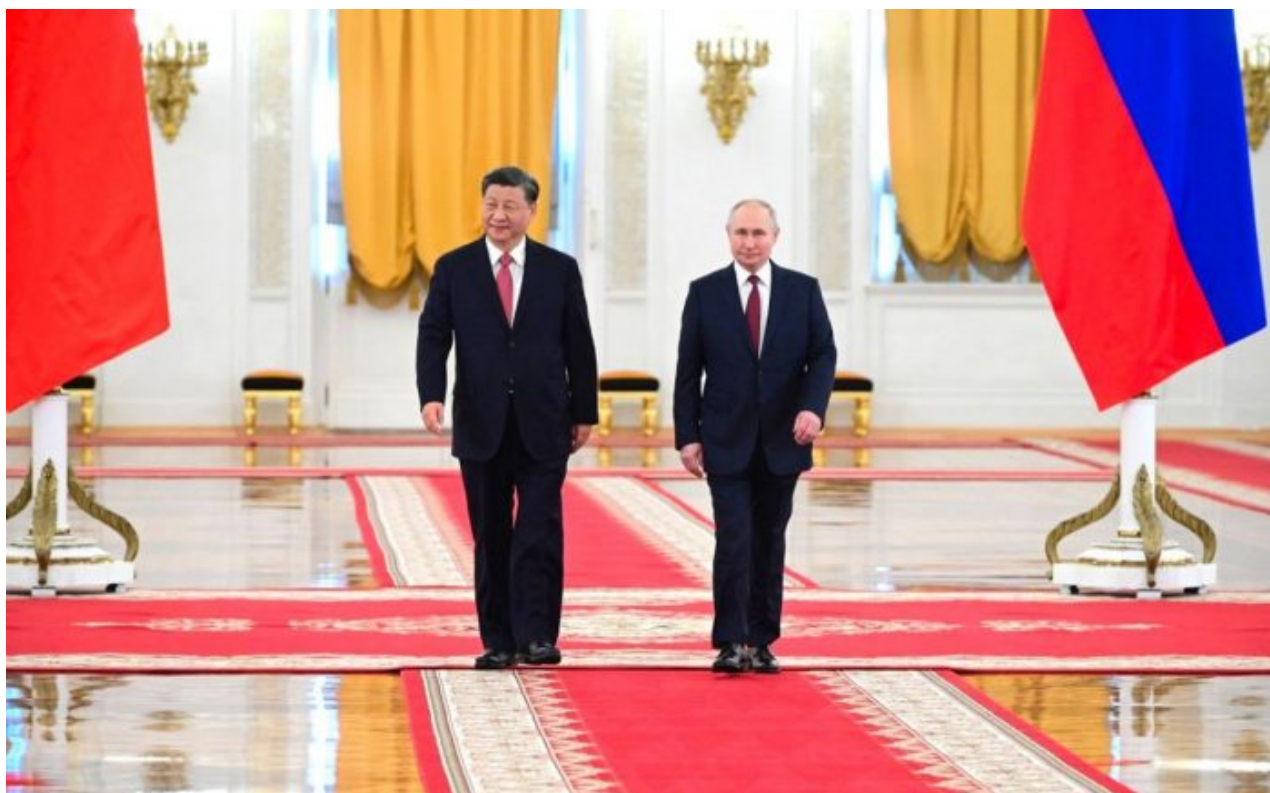
Přivítání čínského prezidenta v Kremlu

V Gerasimovově doktríně je tento podstup vysvětlen snahou o přesvědčení nepřítele, aby přestal útočit špinavými jadernými zbraněmi. Když nepřítel zaútočí špinavou municí, Rusové provedou jaderný taktický úder s malým výkonem 5 až 15 kT na území nepřítele. Problém se špinavou municí je větší, než si veřejnost myslí. Radioaktivní granáty s ochuzeným uranem mají jiný vliv na otevřeném poli a jiný v městské zástavbě. Pokud by začali Ukrajinci touto municí střílet na Doněck, odkud musela ruská vláda vloni evakuovat tisíce dětí s rodinami, protože ukrajinská prasata jim sypala z amerických houfnic dělostřelecké granáty na hlavu každý den, potom spaliny a popel z této munice se dostávají do obydlí, do budov, odkud se tato kontaminace prakticky nedá odstranit.