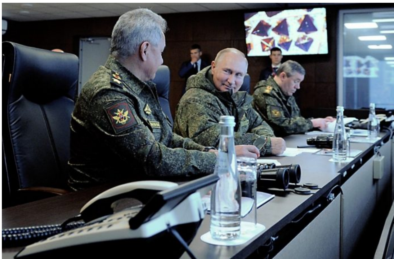
Sergej Šojgu, Vladimir Putin, Valerij Gerasimov