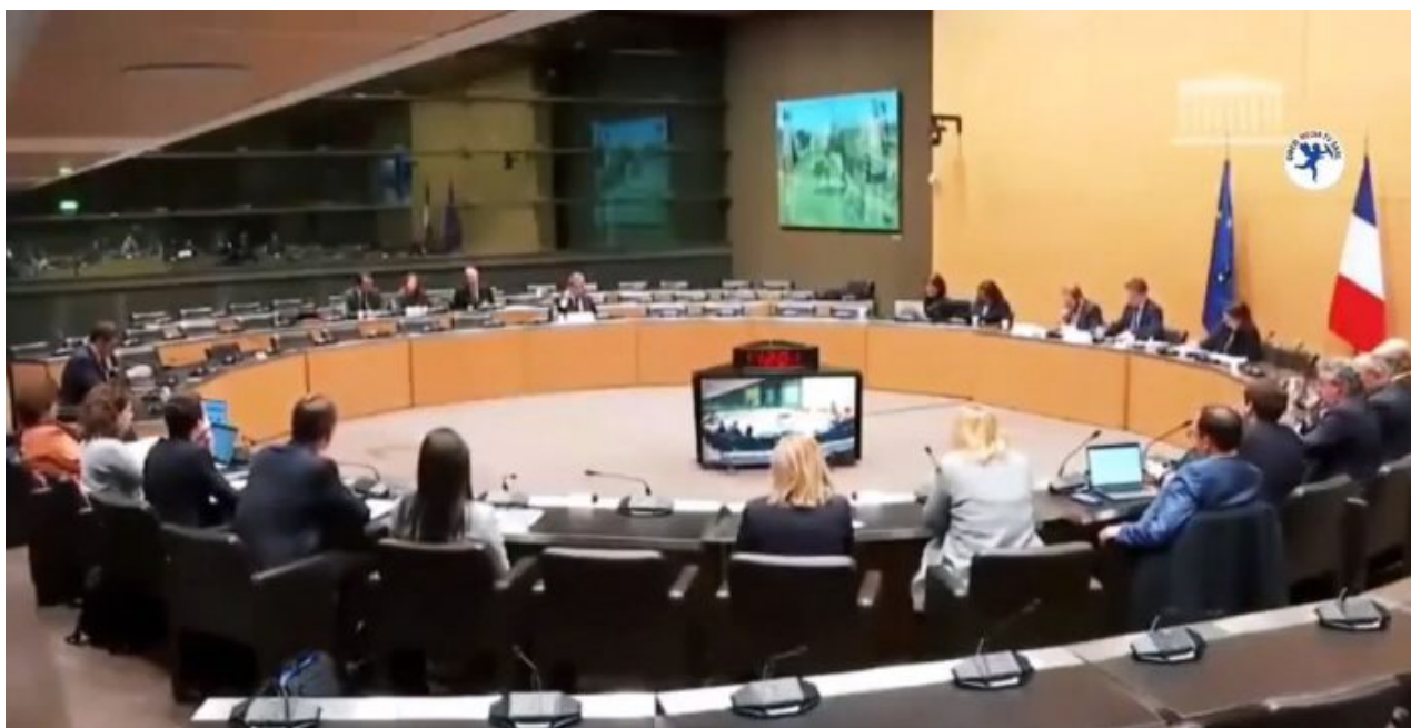
Parlamentní komise Národního shromáždění Francouzské republiky

Každý článek ve výrobě si naučtuje vyšší paliva a energie, což vede k růstu cen zboží. Růst cen zboží tlačí před sebou mzdy, které musí růst společně s inflací, jinak lidé přestanou chodit do práce. Proto nejde snížit mzdy zaměstnancům, ani ve státní správě, ani jinde, ale pouze těm lidem, kteří v pracovním procesu již nejsou, tedy důchodcům. A to je začátek inflačního kolotoče.