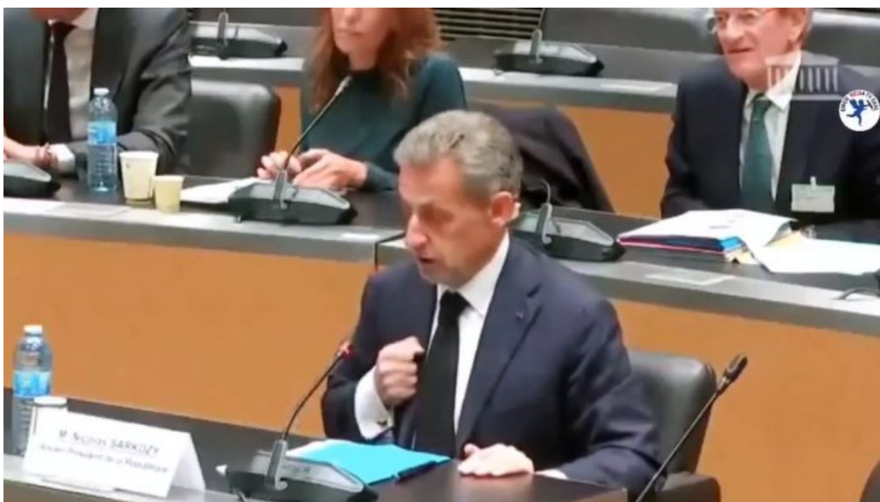
Nicolas Sarkozy před parlamentní komisí

Před komisí zaznělo, že Evropa takovou válku, jaká je na Ukrajině, ještě nikdy v poslední době nezažila, ale to není pravda. Sarkozy se totiž rozpovídal o tom, co bylo hlavní myšlenkou ES, později EHS a dnes Evropské unie. Původním cílem Evropské unie bylo zabránit válkám, aby se už nikdy v Evropě žádná válka neodehrála, protože Evropa je nejbrutálnější kontinent na světě, ze kterého vzešly obě světové války a v historii byla právě Evropa kolébkou nejstrašnějších válek v dějinách. Nikoliv Afrika, nikoliv Asie, ale Evropa je nejbrutálnějším kontinentem. A právě Evropská unie a projekt Evropského společenství měl zabránit další velké válce v Evropě.