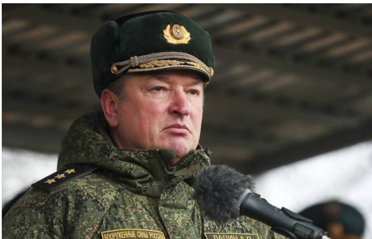
Generál Alexander Lapin, náčelník pozemních vojsk Ruské armády

Sergej Surovikin nařídil již vloni na podzim vybudování zákopů a opevnění v Záporoží a vytvoření minových polí před těmito liniemi. Opevňovací práce probíhaly od října loňského roku nepřetržitě. Ruská armáda počítá s tím, že ofenzíva Ukrajiny bude spuštěna právě na Záporoží, protože nikde jinde by to ani nemělo význam a smysl vzhledem k mamutím opevněním ukrajinské armády, která ale teď již jsou ukořistěna a pod kontrolou Ruské armády, která tato opevnění obsadila a opravila po vytlačení Ukrajinců. Nejslabší opevnění tak jsou právě ta nová, která vznikla na linii v Záporoží a vybuďovala je sama Ruská armáda.