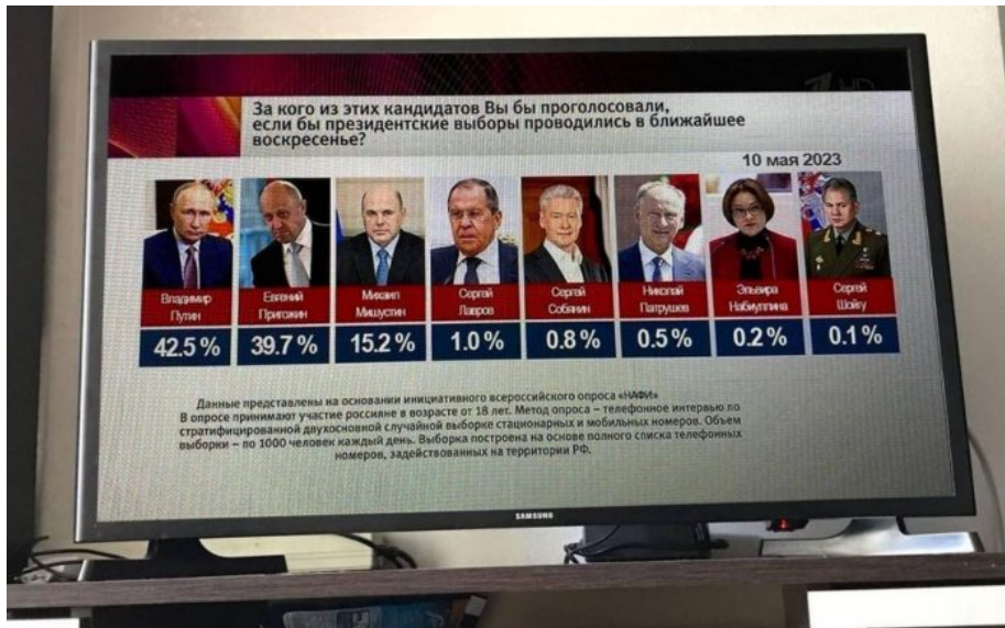
Bleskový telefonický průzkum ruské agentury NAFI

Bez boje 30. motostřelecká brigáda nechala Ukrajince na severním křídle Bachmutu postoupit. Prigožin okamžitě obvinil generální štáb z neschopnosti. Co myslíte, o co se hraje v Bachmutu? Pořád ještě o vítězství nad AFU, nebo už o vítězství Putina nad Prigožinem v březnových volbách příští? Hlavní úkol ruského generálního štábu zní: Je třeba zabít Prigožina! Zatím jen politicky. Začíná moc růst, začíná představovat politickou konkurenci Putinovi. Ten průzkum ukazuje dynamiku v ruské společnosti. A tak najednou se v Bachmutu dějí podrazy na Wagnerovce a najednou Ruská armáda pomáhá Ukrajincům. Rusové nesnáší slabost a ten průzkum ukazuje, že Vladimir Putin ztrácí status silného muže a mocně mu konkuruje Prigožin. V tom je zakopaný atomový pes na Donbasu.