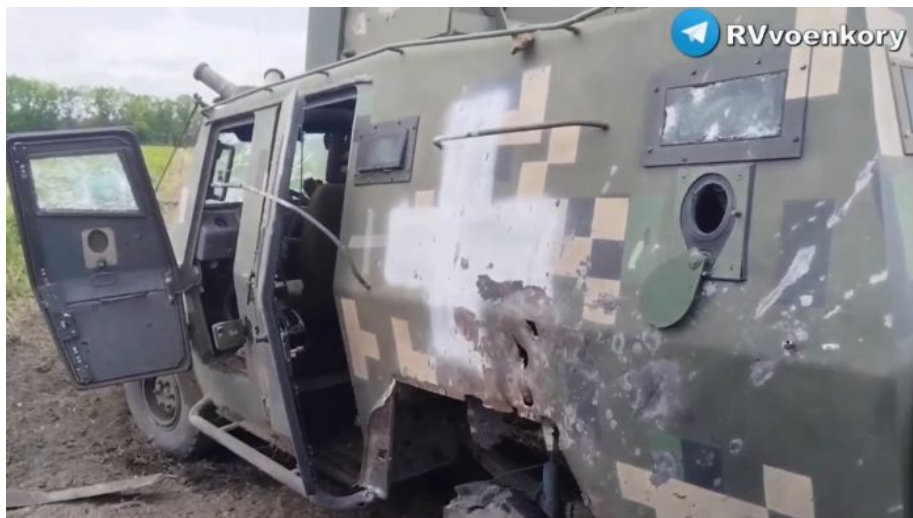
Zničené auto AFU na kontrolním stanovišti Gravjoron v Belgorodské oblasti

Evropa bude v takovém případě ruská a vznikne nový velký Sovětský svaz, o kterém původně uvažoval Josif Stalin jako o “Svazu sovětských socialistických národů” a nikoliv jen “republik”. Ten projekt nakonec Stalin nerealizoval. Pokud ale Ukrajina zažehne III. sv. válku svými útoky proti Rusku za přímé asistence NATO a jejich zbraní, potom tento Stalinův nerealizovaný plán nastane. Je totiž součástí jedné z alternativních iterací vývoje budoucnosti Evropy. Proč to není vyloučené?