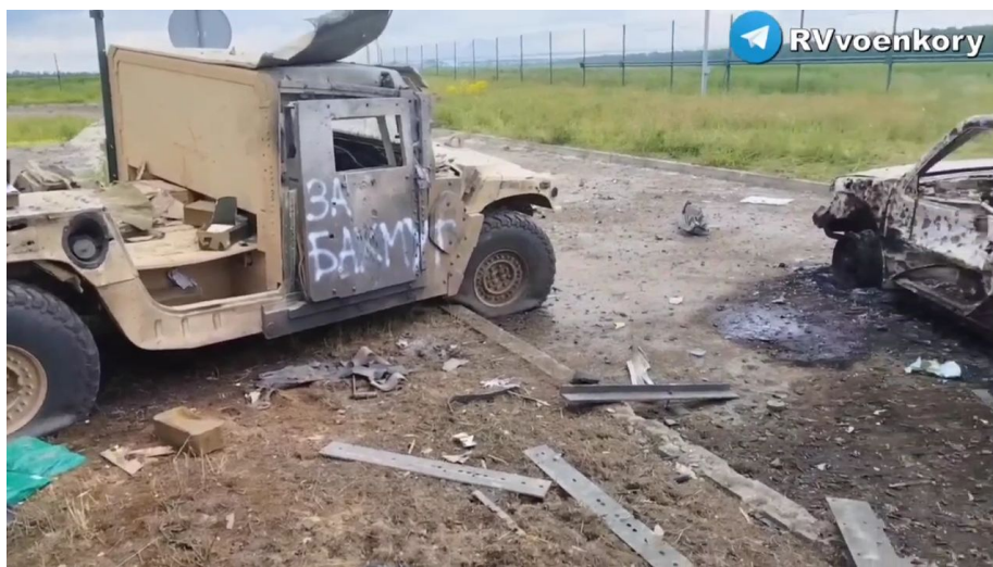
Zničené Humvee AFU na kontrolním stanovišti Gravjoron v Belgorodské oblasti

Západní zbrojovky nejsou dimenzovány na rozsah zbrojení formátu války na Ukrajině a bojů proti jedné z největších armád na světě. Kolektivnímu západu jde o zhroucení Putinova režimu v Moskvě, ale den ode dne je jasnější, že toho nelze dosáhnout na bitevním poli proti Ruské armádě. To je prostě vyloučené ve stavu mírové výroby v EU a v USA.