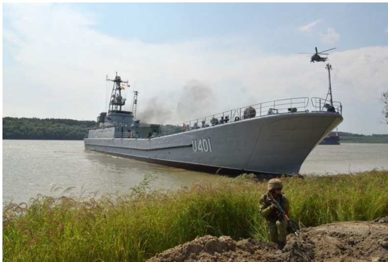
Výsadková loď Jurij Olefirenko

Ale v západních médiích ani čárka, ani písmenko. Západní agentury jen suše konstatovaly, že podle neověřených informací došlo k potopení ukrajinského “člunu” v Oděse. Takhle přesně funguje válečná propaganda. Když nejsou výsledky na bojišti, tak se nahrazují propagandou. Úplně a přesně takovou, jakou předvedl Arestovič v Tel Avivu, anebo jako předvádí americký senátor Lindsey Graham, že Ukrajina prý chystá největší ofenzívu, kterou Evropa nepamatuje od konce II. sv. války.