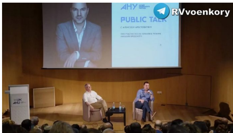
Alexej Arestovič na konferenci v Tel Avivu

po válce ředitelem tohoto úřadu a měl řídit proces přesídlení evropských národů na prostory dobytého SSSR s cílem rozvinutí agrokultury a průmyslu, k čemu bylo v Rusku málo místních lidí.