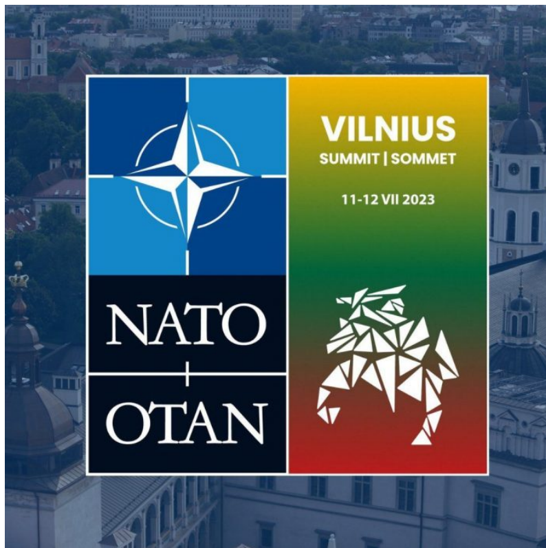
Summit NATO ve Vilniusu