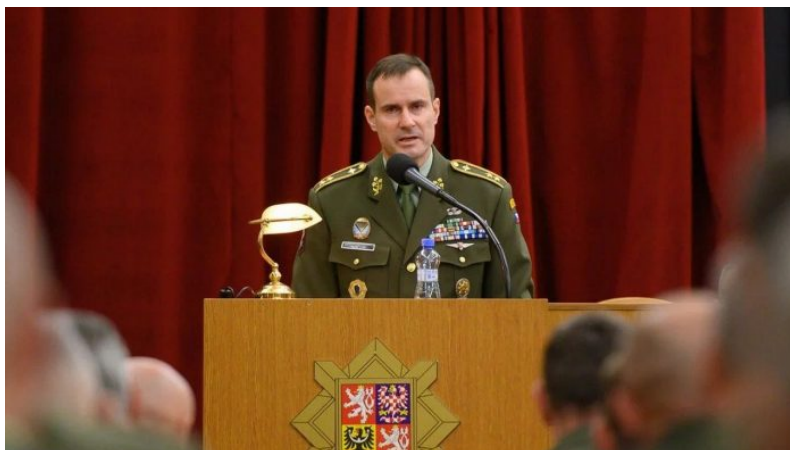
Náčelník GŠ AČR Karel Řehka

Takové jsou odhady výsledku případné války mezi NATO a Ruskem, na kterou se již začala připravovat česká armáda, podle slov [1] náčelníka generálního štábu AČR Karla Řehky. Sovětský svaz se vrátí, je zpátky a ten děs na západě tomu odpovídá. Nechtějí obnovu SSSR připustit, a proto chystají válku mezi NATO a Ruskem. Proto se snaží Rusko zatáhnout do přímého střetu s NATO, doslova o to západ usiluje a provokuje Rusko, aby se nechalo do přímého střetu s NATO zatáhnout.