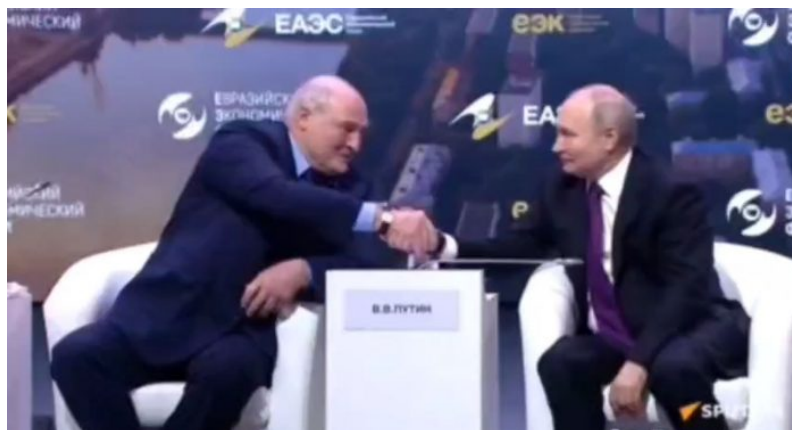
Alexander Lukašenko a Vladimir Putin v okamžiku, kdy Tokajev hovořil o jaderných zbraních

Ale přitom na straně druhé to hraje i na stranu Západu a Kazachstán oznámil, že bude dodržovat západní sankce na Rusko. Po příjezdu do Moskvy dostal určitě kartáč a bylo mu připomenuto, že kdyby Rusko uvalilo sankce na Kazachstán, např. proti gastarbeiterům z Kazachstánu pracujícím v Rusku, došlo by v Kazachstánu k nepokojům a Tokajev by čelil další revoluci z ulice. Jeho vystoupení v Moskvě je doslova konceptuální čítanka. Je potřeba něco udělat, nedá se svítit, ale radost z toho nemám, ale musíme začít o tom jednat. Asi takto by se dalo shrnout Tokajevovo vystoupení.