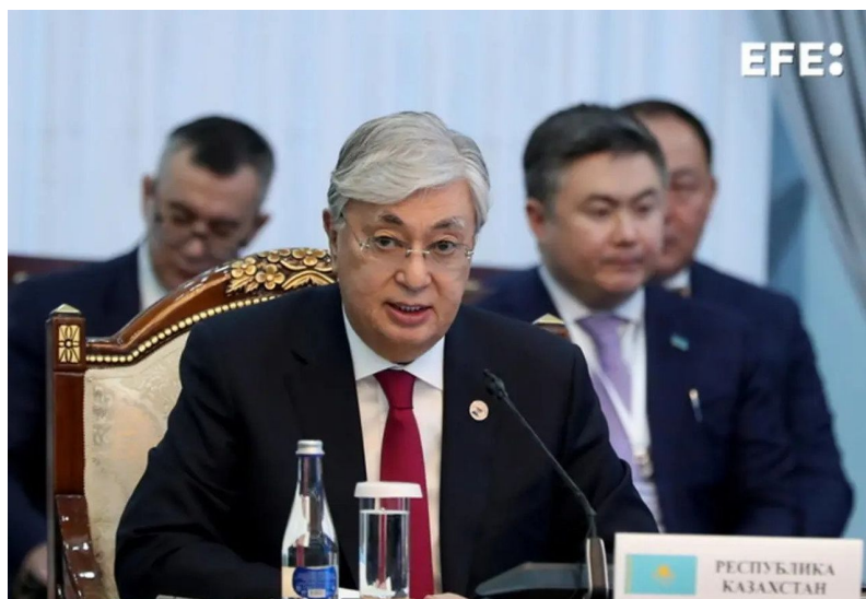
Kasim Tokajev, prezident Kazachstánu

Všimněte si ve videu, jak měl Tokajev nejistý a roztrášený hlas, protože evidentně z toho moc nadšený nebyl, ale nemohl cuknout, zatímco kamera provedla střih na Lukašenka a Putina, jak se usmívají a podávají si ruce po zmínce Tokajeva o jaderných zbraních. Symbol byl vyslán. A opravdu velice drsný symbol. Tokajev je velice rozporuplná postava. Je si vědom na jedné straně naprosté ekonomické provázanosti Kazachstánu na ruský trh a průmysl, je si vědom, kolik milionů Kazachů pracuje v Rusku, protože pro ně v Kazachstánu není práce a potom z Ruska posílají domů rodinám peníze.