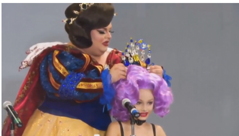
Americká genderová výchova mládeže. Drag Queen a chlapec přestrojený za dívku

Tohoto procesu se dá sice dosáhnout mnoha prostředky, ale eugenická indukce genderové transformace nové generace a mladých lidí je de facto stejně účinná jako kastrace nebo lobotomizace. Eugenicky lze chlapce transformovat na dívky a dívky na chlapce, takže nikdy nebudou moci plodit děti. A ta zručnost a děsivost plánu spočívá v tom, že to není násilná kastrace, ale propagované právo a privilegium už i malých dětí. Eugenická indukce neplodnosti skrze genderové zásahy do vývoje mládeže se přitom násobí geometrickou řadou v čase. Čím více dětí je procesu vystaveno, tím více tento proces zesiluje poté, co děti vyrostou a začnou genderizaci a změny pohlaví tlačit do hlav všem ostatním lidem okolo.