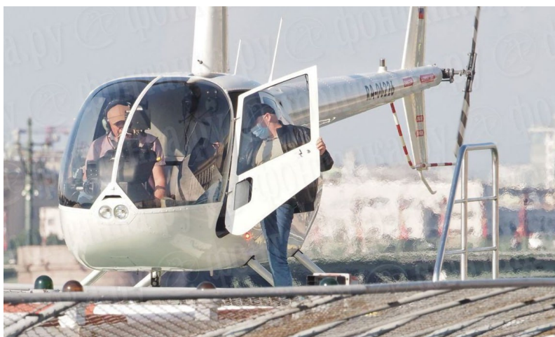
Jevgenij Prigožin v Petrohradu, 29. 6. 2023