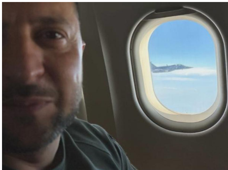
Zelebuben v českém vládní letadle zachytil českou stíhačku Gripen doprovázející letadlo

Pentagon totiž oznámil [3], že USA dodají Ukrajině mezinárodně zakázanou kazetovou municí, což zvedlo odpor dokonce už i v Německu, ve Španělsku, ve Francii a v dalších zemích NATO, které s tím nesouhlasí. Kazetová munice je považována za zbraň hromadného ničení, protože patří do skupiny tzv. indiskriminačních zbraní. To je skupina zbraní hromadného ničení, při jejichž požití nelze minimalizovat kolaterální škody. Nejčastěji jdou o rakety naplněné desítkami či stovkami šrapnelových granátů, které se ještě ve vzduchu pomocí výbušniny rozptýlí do velkého okruhu a poté dopadají na rozsáhlou plochu. Zákaz této munice v mnoha zemích spočívá v tom, že na válečném poli není pro tento typ zbraní rozumného využití, ovšem velký význam mají při použití v civilní zástavbě.