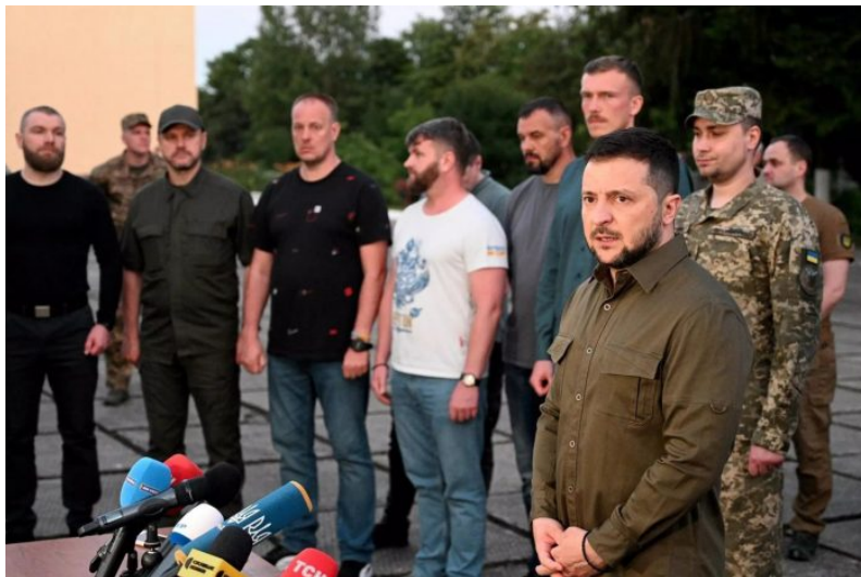
Zelenský na tiskové konferenci s Azováky po jejich návratu z Turecka

A to je velmi nebezpečná situace pro Vladimira Putina, protože to vysílá nebezpečný vzkaz i mnohem důležitějším partnerovi Ruska než je Turecko, a to je Čína! Pokud by i Čína přestala plnit dohody, pozice Vladimira Putina by byla opravdu ohrožena. A není vyloučeno, že toto, co provedl Erdogan, je testovacím a zkušebním balónem právě pro Čínu, která teď bude analyzovat a sledovat odvetu Ruska proti Turecku.