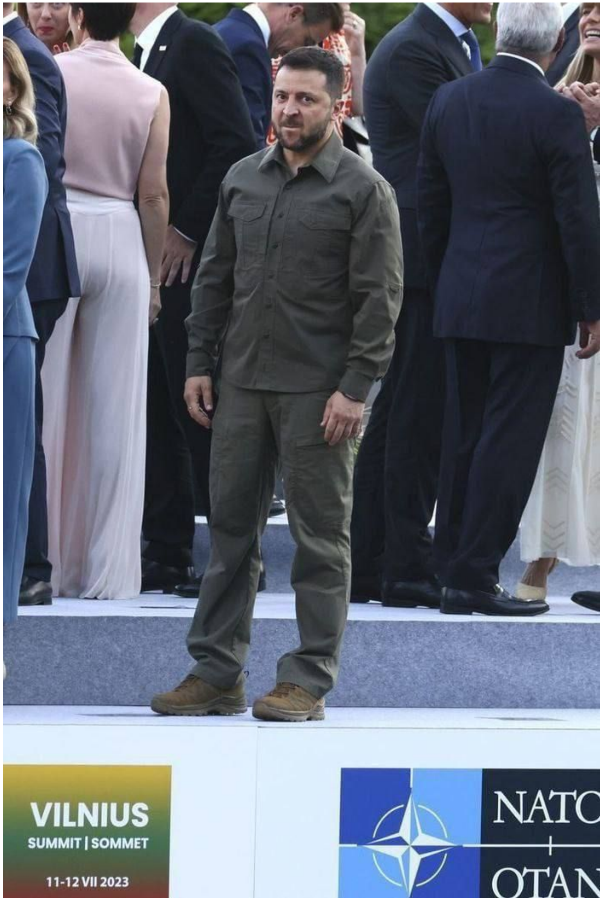
Volodymyr Zelenskyy – Left Alone in Vilnius