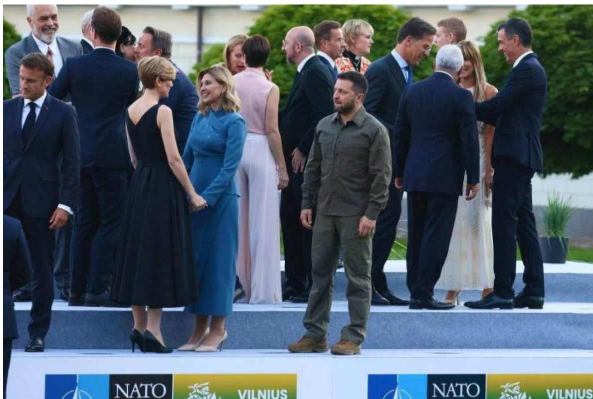
Tato fotografie vystihuje podstatu a skutečné postavení Ukrajiny v Evropě. Volodymyr Zelenskyy – Left Alone

na papír. Rozčílilo ho, jak Kyjev klade na Londýn více a více požadavků a sepisuje je na papír a předává je Londýnu jako objednávky v Amazonu. Ukrajina je přesně v roli Iráku ve válce s Íránem.