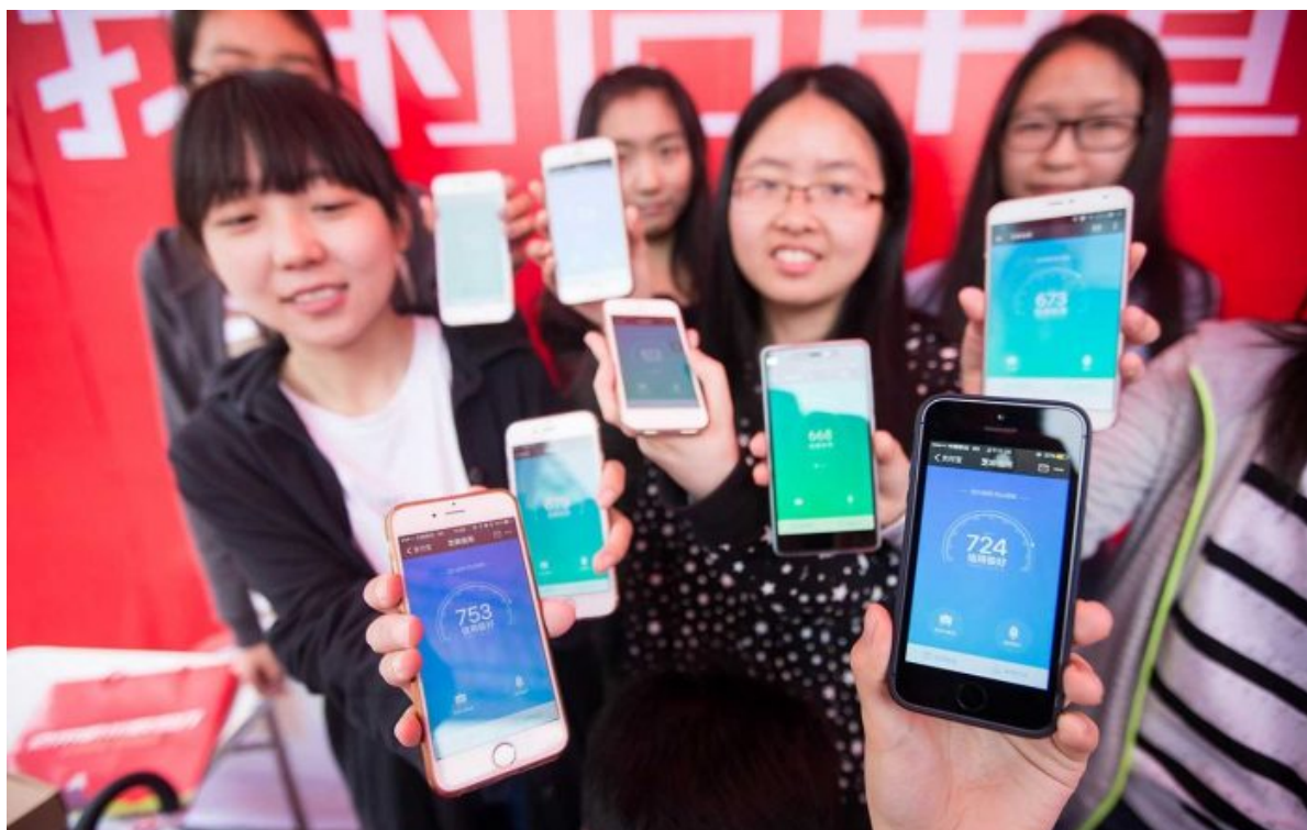
Aplikace WeChat společnosti Tencent zobrazující čínské sociální skóre

hodnotě k dolaru, přičemž celou dobu centrální banka tvrdila, že rubl je stabilní a západní sankce na rubl nemají dopad. Co se stalo? No přece je to jasné, co se stalo. Ruská centrální banka připravuje půdu na přechod Rusů k pevné a stabilní digitální měně! To je přesně to, co se právě děje! A to samé očekávejte v USA s americkým dolarem, kde pád amerického dolaru se stane záminkou k přechodu na americký digitální dolar, který je již rovněž testován od ledna tohoto roku.