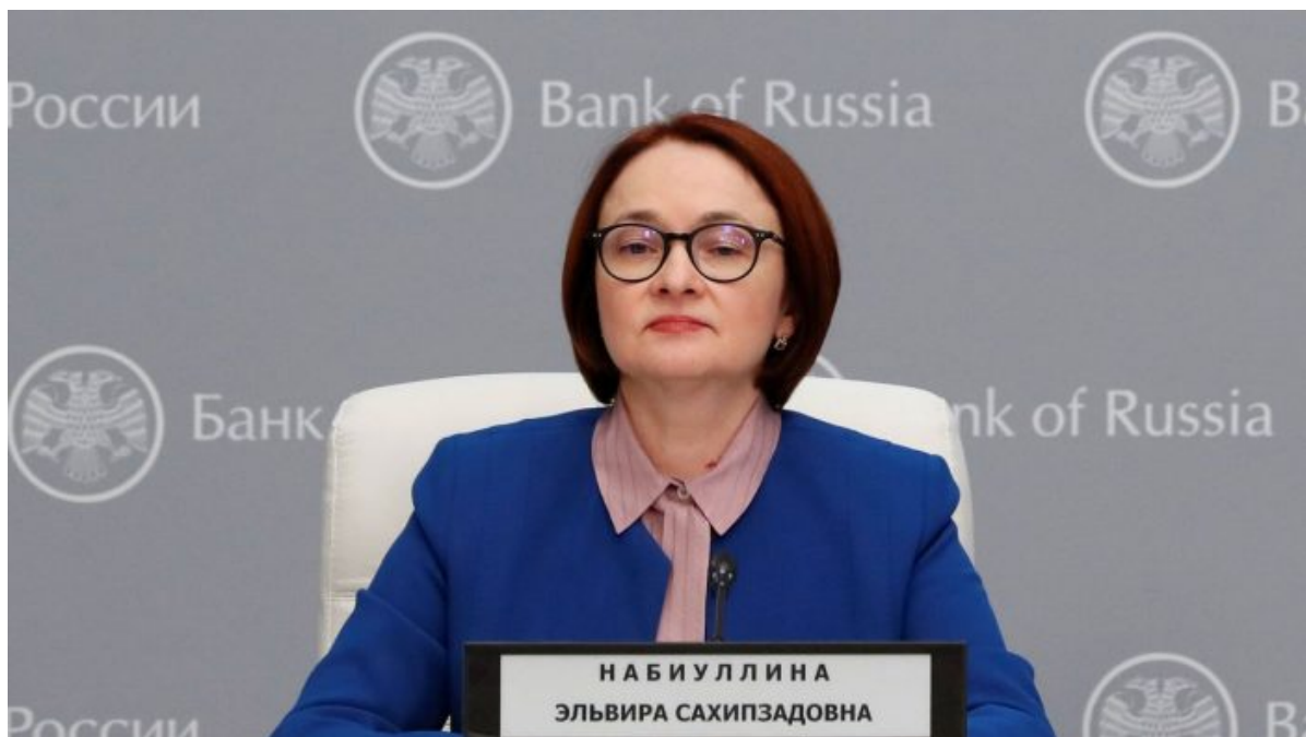
Elvira Nabiullina, šéfka Ruské centrální banky, která stojí za vznikem digitálního rublu

A to je proces, který probíhá při tzv. růstu HDP, když komerční banky svými úvěry zvyšují objem peněz v oběhu. Jenže, s tím bude v době CBDC konec. Emise tokenů bude řídit jen centrální banka, která bude autorizovat v budoucnu půjčky komerčních bank. Ty už nebudou emitovat peníze jako dosud formou úvěrů klientům, ale bude to probíhat s přímou účastí centrální banky, která pro komerční banku vyemituje tokeny.