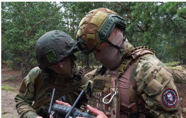
Wagnerovci cvičí Běloruskou armádu v používání dronů

Ale Rusko v té době už nebude moci být za činnost PMC Wagner odpovědné, protože Kreml bude argumentovat, že od 24. června, kdy proběhl pokus o “puč” Wagnerovců, již nemá Moskva nad Wagnerovci kontrolu , odted' jednají soliterně sami za sebe, protože došlo k jejich vyhoštění z Ruska a od toho okamžiku za ně zodpovídá výhradně a pouze ta země, která je oficiálně k sobě pozvala!