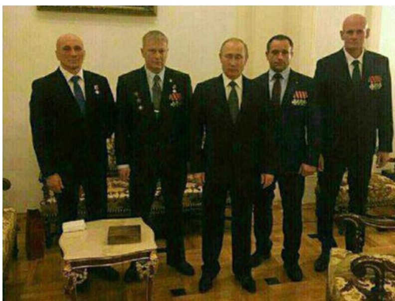
Vladimir Putin během ceremoniálu v Kremlu při předávání medailí za zásluhy v operaci v Sýrii. Úplně vpravo Dmitrij Utkin, nejvyšší velitel PMC Wagner

Jisté je jenom to, že Rusko zodpovědnost neponese. Může ji však nést teoreticky Lukašenko, kterého západ obviní, že na svém území poskytuje přístřeší a ochranu teroristické organizaci, a proto západ na Bělorusko uvalí sankce úplně stejného rozsahu, jaké byly uvaleny na Rusko. Tím dojde k totálnímu přimknutí a připoutání Běloruska k Rusku, protože Lukašenko už nebude moci sedět na dvou židlích, na východní a západní současně. A proč Vladimir Putin souhlasil a rozmístil jaderné taktické rakety Iskander-M na území Běloruska? No přece proto, aby země NATO po zahájení operací Wagnerovců v Polsku nevtrhly do Běloruska pod záminkou, že tam Lukašenko přechovává tábory Wagnerovců!