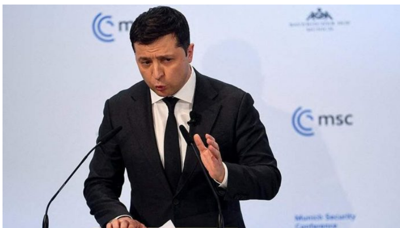
Volodymyr Zelenskyy na bezpečnostní konferenci v Mnichově, 20. 2. 2022

A to je samo o sobě potvrzením neúspěchu západní koalice v plánu na izolaci Ruska. A nejen, že se nepodařilo Rusko izolovat, ale západní sankce na Rusko navíc vyděsily Čínu, která po dlouhé době váhání se naplno pustila do projektu odchodu od amerického dolaru a k posilování vztahů s Ruskem. A to neměl západ vůbec v plánu, když uvaloval sankce na Rusko. Cílem nebylo oslabit americký dolar, ani nastartovat cestu zemí 3. světa na cestu odchodu od amerického dolaru. To je pro kolektivní západ něco, k čemu nemělo dojít. Cílem celého projektu od roku 2014 bylo vybudovat z Ukrajiny hotové Anti-Rusko prostoupené nacisty a nacistickými symboly a móresy, aby to vyprovokovalo Rusko k invazi na Ukrajinu.