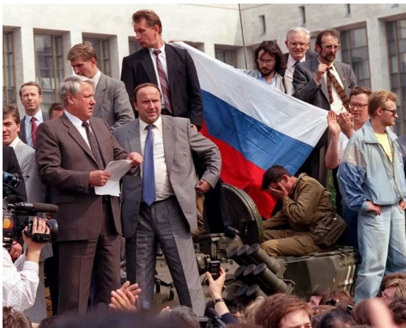
Ekonomický kolaps a prázdné obchody v Moskvě vynesly v roce 1990 z ulice k moci Borise Jelcina

Všechno se totiž dováželo ze zemí RVHP, ale po převratech ve východoevropských zemích v roce 1989 se dodávky zboží do SSSR zastavily. Tohle se mělo zopakovat minulý rok po uvalení sankcí na Rusko. Jenže, tentokrát zastavení dovozu zboží ze západu do Ruska ke kolapsu v Moskvě a nikde v Rusku nevedlo. Rusko se od roku 2014 stalo potravinově soběstačnou zemí, a co ruský průmysl neumí vyrobit, to se dováží z Číny a ze zemí BRICS. A vlastně z celého světa, ze 150 zemí světa!