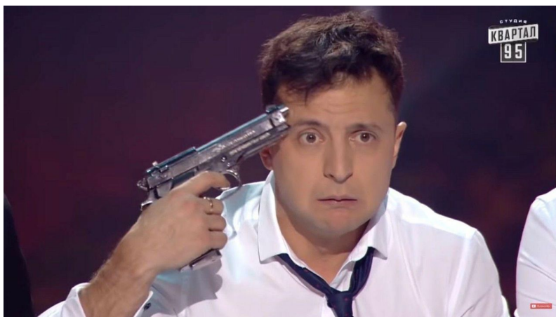
Zelenský v komediálním pořadu s pistolí u hlavy. Brzy to už nemusí být jen skeč z komediální scénky, ale drsná realita na konci kariéry jednoho politika, který přivedla na smrt statisíce vlastních občanů

Teprve hrozba Zelenského, že zahájí program výroby vlastní jaderné kapacity dotlačilo Vladimira Putina k tomu, že vtrhne s armádou na Ukrajinu. Američané a kolektivní Západ se dočkali. Konečně po 8 letech se podařilo Rusko vyprovokovat k invazi na Ukrajinu. Proto byly západní sankce uvaleny na Rusko tak rychle, protože byly 8 let dopředu připraveny a nachystány. Jenže efekt sankcí se nedostavil. Na Rusko nefungují buď vůbec, nebo jen s velmi malým dopadem, který není natolik silný, aby vedl k nepokojům v Rusku, k občanské nespokojenosti a k protestům. Tohle sankce prostě nezařídily. Rusko je totiž, na rozdíl od počátku 90. let, proti přerušení dovozu západního zboží na ruské trhy imunní.