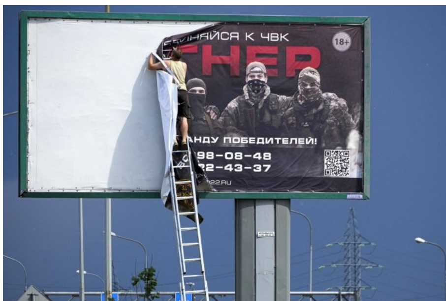
Sundávání billboardů PMC Wagner v Moskvě druhý den po tzv. puči

O tom, že tomu odpojení Wagnerovců od Kremlu západ uvěřil, svědčí i výrok zástupce maršálka polského Senátu. Michal Kaminski prohlásil [2], že pokud Wagnerovci vstoupí do Polska, budou považováni za teroristy a do Ruska budou odesláni v rakvích. Teroristy od Wagnera prý zpacifikují polské a americké jednotky. Z těchto výroků je zjevné, že ani Polsko nebude považovat diverze PMC Wagner v Polsku za válečný akt Ruska. Bude to "jen" terorismus.