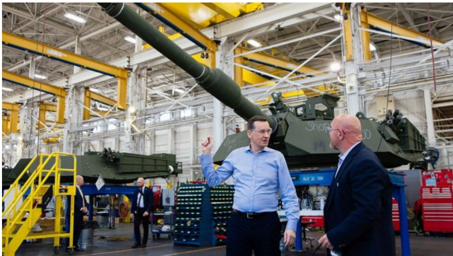
Mateusz Morawiecki s ukrajinským premiérem Denysem Šmyhalem v polské zbrojovce