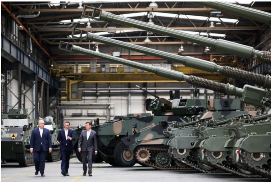
Mateusz Morawiecki při návštěvě zbrojovky Huta Stalowa Wola, kde se vyrábí houfnice Krab

Jenže po zvolení Donalda Trumpa a po jeho opětovném odstavení Kongresem na vedlejší kolej by Deep State zahájil největší zbrojný výrobu od konce II. sv. války, se kterou by se ani ruský průmysl nedokázal vyrovnat. Deep State do toho zatím nešlápl na plný plyn jen a právě proto, že v USA budou volby a před volbami takové zbrojení nelze spustit. Voliči by na to reagovali velmi zle. Proto reálně Kremlu hrozí, že pokud se nic nezmění, po skončení amerických voleb příští rok v listopadu spustí USA nové kolo horečného zbrojení.