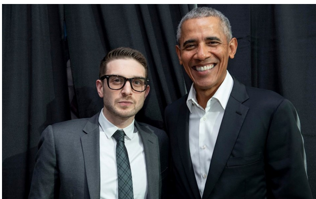
Alex Soros, nový šéf Open Society nadace a Barack Obama

úvaha, kterou se zjišťuje fyzikální vědomí studentů. Jakou barvu má bílá vlajka v dokonalé a absolutní tmě? A jako barvu má černý prapor v absolutním světelném toku? Tohle se používá nejen ve fyzice, ale i v konceptuální gramotnosti. Na barvě praporu samotného totiž ve skutečnosti i ve fyzice nezáleží.