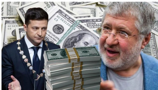
Peníze na Zelenského volební kampaň v roce 2019 poskytl Igor Kolomojshy na základě dosud neobjasněného blízkého vztahu mezi ním a Zelenským

Tohle se píše na ukrajinských sociálních sítích, že Zelenský a Kolomojshy spolu měli a možná dost pořád mají intimní vztah. Štěbetají si o tom vrabci nejen v Kremlu, nejen na ukrajinských telegramech, ale i v Praze v okolí Fialovy vlády. Vyzývavost Zelenského jako komedianta byla obrovská a jeho transvestity výstupy ho přivedly ke Kolomojshkému a k jeho šrajtoflí.