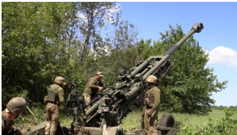
Ukrajinská četa u houfnice M-777

A po vyhazovu ministra obrany Ukrajiny nastal další krok, a to je shánění masa do ukrajinské armády po celé Evropě! Na Ukrajině už totiž není kde brát. Právě proto začaly po celé Evropě neuvěřitelné scény, donedávna naprosto nevídané. A není proto divu, že Ukrajinci teď zvažují emigraci ze zemí EU do jiných zemí EU, které Ukrajince na Ukrajinu nevydávají. Kromě Česka se nově mohou spolehnout na Rakousko, které již také oficiálně oznámilo [3], že Ukrajince uprchlé před mobilizací na Ukrajinu vydávat nebude.