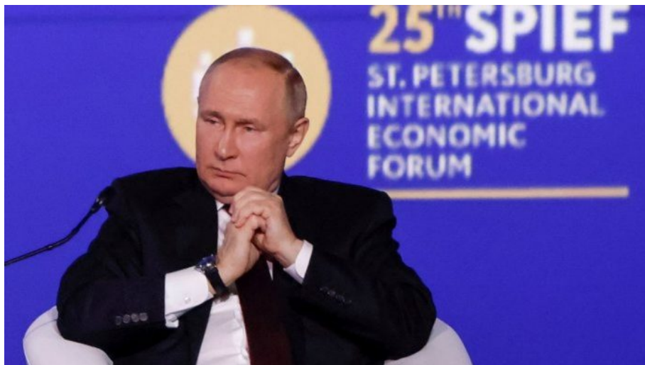
Vladimir Putin, prezident Ruské federace

Ekonomický rozvoj Jižní Koreje po skončení války totiž nastal kvůli garanci a rozmístění americké armády v Jižní Koreji, která fungovala a dodnes funguje jako psychologická pojistka pro západní investory , že KLDK nevrhne do Jižní Koreje a nedojde ke znárodnění západních investic a podniků v Jižní Koreji. Jenže na území Ukrajiny v případě příměří žádný takový kontingent americké armády nebude. A to právě kvůli strachu z oživení války s Ruskem po vstupu US Army, a tentokrát v přímém střetu Rusů s NATO. Proto se nedá očekávat, že se investoři pohnou na Ukrajinu a bez peněz a investic nemůže Ukrajina přežít. Proto krach Ukrajiny po vyhlášení a dojednání eventuálního příměří je velmi pravděpodobným scénářem.