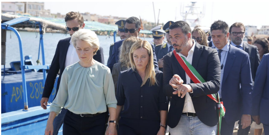
Šéfka Evropské komise Ursula von der Leyen a italská premiérka Giorgia Meloni při návštěvě uprchlického tábora na Lampeduse

Podobně jako před 2 lety, nic jiného než Covid se do médií nedostalo. Rozpoutáním požáru na Ukrajině se tak odvedla pozornost veřejnosti od migrace a do Evropy proudí už desítky tisíc mladých mužů, vlastně nikdo jiný než mladí muži, kteří nechali své ženy, děti a rodiče doma ve válkou zmítané zemi, před kterou prý utíkají jen oni sami, ostatní z rodiny tam nechali.