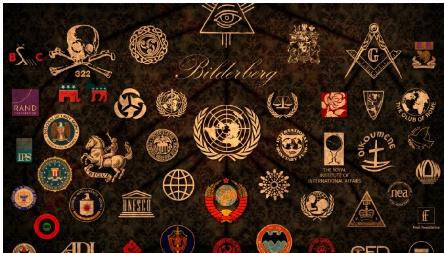
Organizace a spolky zapojené v globalistickém trustu Bilderberg

V mnoha velkých čtvrtích evropských měst byl Arabský rovník překročen již před několika lety a postupně vysoká porodnost překreslí jednotlivé demografické svazky v celé Evropě. A právě to staré francouzské přísloví platí na 100% na válku na Ukrajině. Ta totiž dokonale vyhovuje globalistům a odvádí pozornost od obnovení procesu na reformu Evropské unie pod názvem “Das neue Europa” v obrazu černého muže a jeho bílé konkubíny , která mu bude rodit mulaty. Tento proces byl schválen v roce 2012 na konferenci Bilderberg ve Washingtonu a proces dostal děsivé označení The Great Replacement – Velká výměna (obyvatelstva).