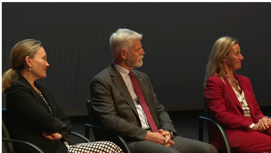
Petr Pavel, vpravo Federica Mogherini

Snížení závislosti je totiž prvním krokem před zbavením se závislosti na USA úplně. A přesně o to se teď hraje v rámci globalistických procesů v Evropě s cílem odpisu USA na starém kontinentu. Generál a prezident Petr Pavel tenhle výrok neřekl náhodou a ani omylem. Bylo to pečlivě připravené a zaznělo to v hnízdě globalčiků na Evropské univerzitě v Bruggách, zaznělo prostě to, co chtěli globalčiky slyšet a opravdu to zaznělo. Petr Pavel sice mluvil o potřebě a významu NATO, ale na závěr projevu to zazdil takovým výrokem, jako že snížení závislosti na USA posiluje transatlantické vztahy.