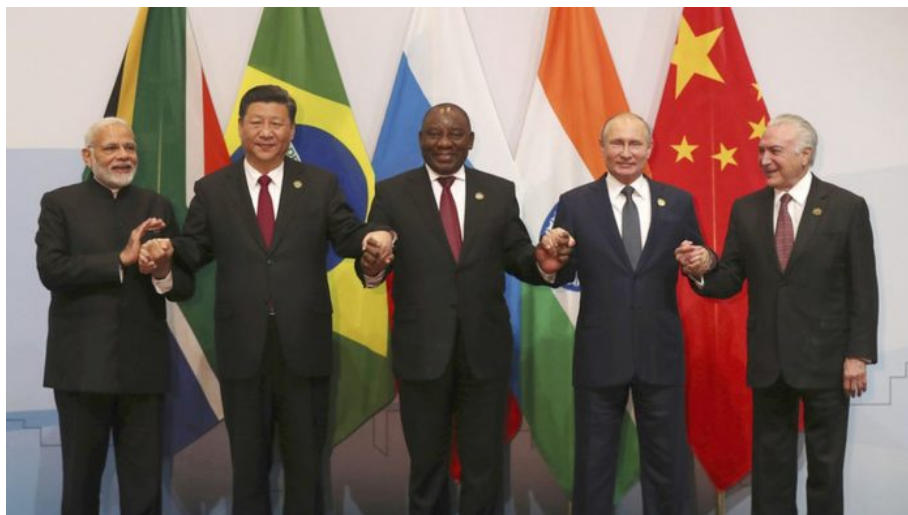
BRICS je v podstatě náhradou systému Pax Americana

A protože Petr Pavel je generál a ví, co se vlastně děje, tak najednou jede do Brugg a na globalistické univerzitě začíná vypouštět slova o potřebě reformy hlasování v EU, rozhodování v EU a o potřebě vybudování evropských strategických nástrojů, tedy Evropské armády, aby se EU postupně zbavila závislosti na USA. Generál-prezident Pavel je jako rosnička, která dokonale předvidá přicházející počasí. Stačí sledovat jeho změny postojů v projevech a zjistíte, jaké procesy se chystají. V USA z toho bude jistě velké rozčarování, ale u vojáků je to známé, že když se mění stav na bojišti, je potřeba zaujmout novou pozici, což Petr Pavel umí naprosto dokonale, to se mu musí nechat. A ta nová pozice je jasná. Postupná demise americké moci Pax Americana v Evropě!