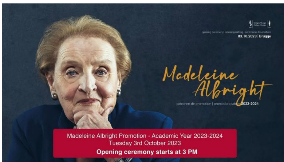
Slavnostní zahájení akademického roku na Evropské univerzitě v Bruggách s hlavním tématem vzpomínky na Madeleine Albright

Ne, snížení závislost EU na USA bude znamenat zbavení se závislosti na USA a zbavení se procesů řízení vycházejících z Washingtonu. Pavlův projev byl mistrovským rozprašováním maskovacího dýmu a mlhy, jak to umí nejlépe právě vojáci. Slova chvály a obdivu k NATO a na závěr slova o potřebě zrušit právo veta v EU a o potřebě snížení obranné závislosti Evropy na USA. Můžete říct jednu věc deseti různými způsoby během jednoho projevu, ale pokud na závěr řeknete, že chcete snižovat na někom závislost, tak to znamená, že do budoucna již nepočítáte s žádnou závislostí na daném subjektu. To je zcela zjevné.