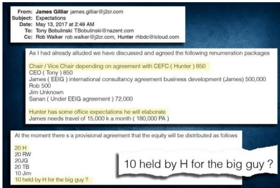
Emaily vytěžené z Hunterova notebooku

Biden je tak v podstatě první americký prezident placený z peněz čínských komunistů a ukrajinských oligarchů, přes které pere peníze. A když se posílají peníze na Ukrajinu, jaký podíl z Ukrajiny za tu pomoc potom Biden inkasuje zpátky přes pračku několika firem jako “splátku půjčky” od bratra? Představte si, jaký řev by se rozléhal v médiích kolektivního západu, kdyby místo Joe Bidena se jednalo o Donalda Trumpa , u kterého by se zjistilo, že skrze rodinu pral a poté inkasoval peníze od čínského komunistického politbyra.