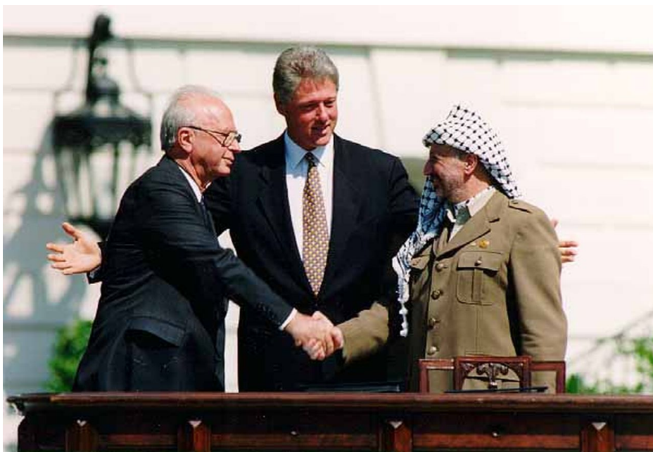
Jicchak Rabin, Bill Clinton a Jásir Arafat, 13. září 1993 v Bílém domě po podpisu Protokolu z Osla o mírovém procesu

A přesně proto teď Netanyahu prohlásil, že Izrael již podruhé chybu neudělá, jako ji udělal v Oslu roku 1993. Pokud ale Gaza nesmí být podle Bendža Netáhla pod vládou ani Hamásu, ani Fatáhu, tak pod jakou vládou bude? Logicky pod žádnou vlastní vládou, ale po nějakou okupační vládou, protože Hamás i Fatáh představují prakticky všechny Palestince, kteří se účastní politického procesu. A žádná jiná strana mezi Palestince prostě nevznikne. Minimálně žádná taková vláda nebude mít podporu Palestinců.