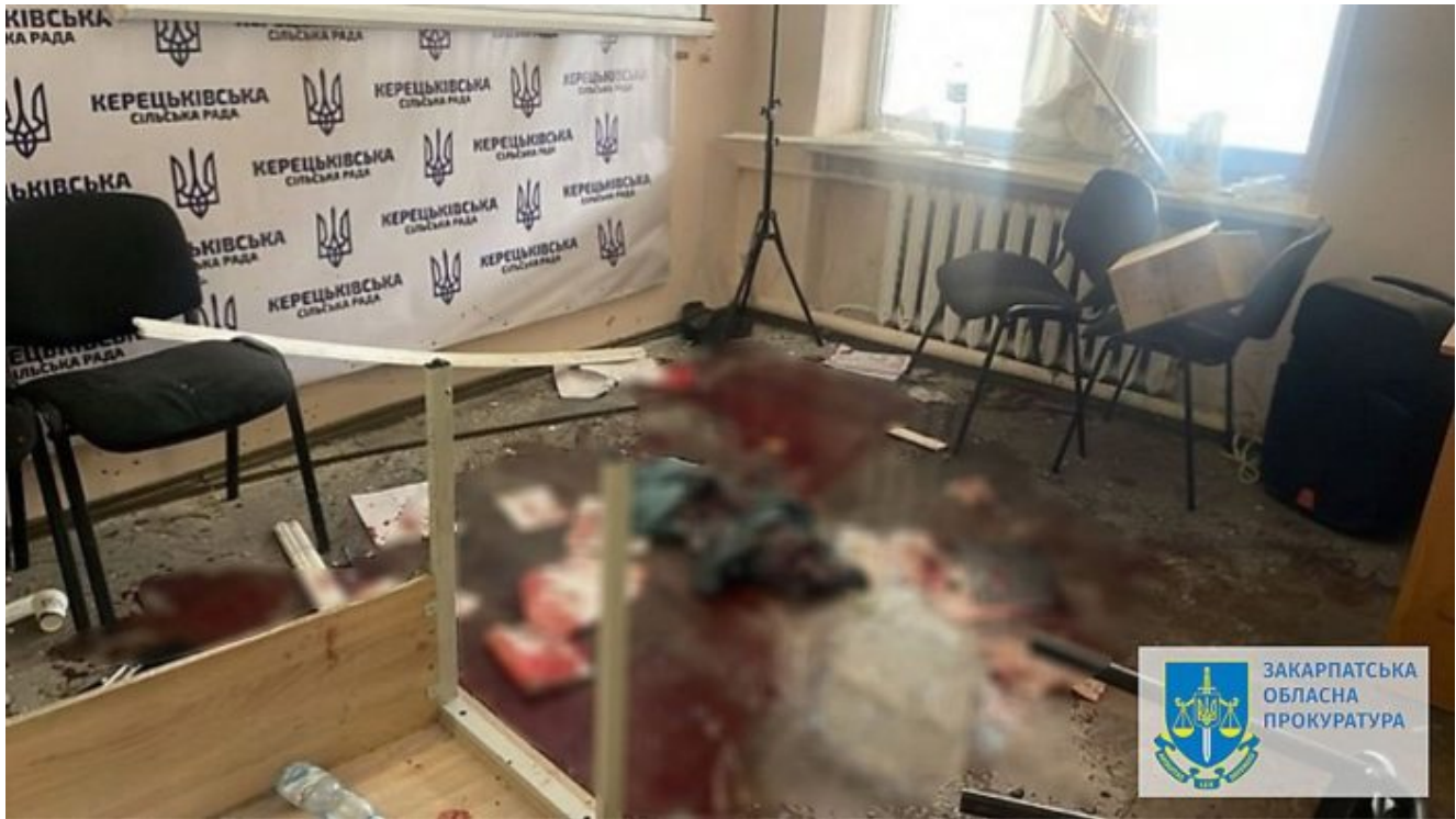
Místo činu na snímku ukrajinské policie