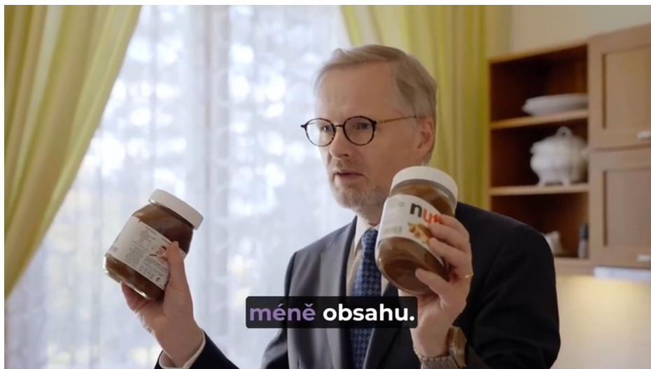
Profesor Nutella dovedl ČR k propadu HDP do záporných hodnot za rok 2023

ale Rusko minulý měsíc v prosinci zakončilo rok 2023 s ekonomickým růstem HDP na úrovni 3.2% [3] a zařadilo se mezi nejrychleji rostoucí ekonomiky na světě ve srovnání se zeměmi EU nebo v porovnání s ČR, která měla za rok 2023 negativní růst -0,7% HDP za třetí kvartál loňského roku [4].