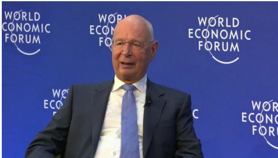
Klaus Schwab v Davosu na konferenci Světového ekonomického fóra

Bez digitálního účtu CBDC a bez UBI si nekoupíte oblíbené maso a jídlo, protože pouze skrze digitální peněženku budete mít přístup k tzv. emisním potravinám. Pěstování živočišných a rostlinných zdrojů potravin bude pro jednotlivce zakázáno jako ekologický terorismus, tedy nedovolené produkování emisí CO 2 a NO x . Osoby přistižené při samochovu a samopěstění potravin budou označeni za teroristy, kteří soustavně otravovali atmosféru a dokonce úmyslně s produkcí načerno obchodovali.