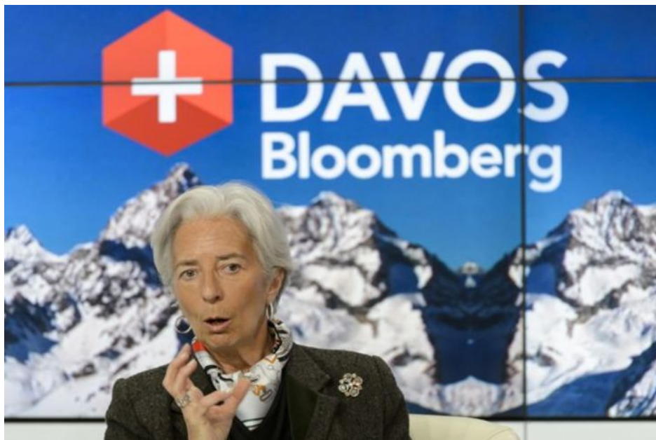
Christine Lagarde, šéfka Evropské centrální banky na zasedání WEF v Davosu v roce 2022

Dnes se říká, že krávy a prasata smrdí a škodí klimatu, takže je musíme vybit a začneme jíst cvrčky a červy. Ten proces je úplně totožný. System posune Overtonovo okno do pozice, že něco, co bylo včera normální, je dnes nežádoucí a škodlivé, takže je potřeba to zakázat. A lidi to jako ovce přijmou. Jako přijali zrušení kuřáckých salónek v hospodách, kde kuřáci nikomu neškodili, jen tak maximálně sobě. Přejde brzy doba, kdy zakáží hovězí, vepřové, kuřecí, cukr, tuky, pivo a alkohol, protože to škodí. Klimatu! Chápete? Dovolí vám si to koupit, ale pouze s obrovskou daní. A pouze tehdy, pokud budete mít dobrý sociální kredit.