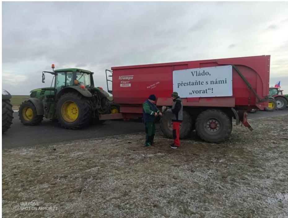
Protest českých zemědělců v Chomutově.

se především promítají do živočišné výroby, je zásadní politické téma a agrární komora by se měla proti vládě Petra Fialy silně vymezit a postavit se za protestující.