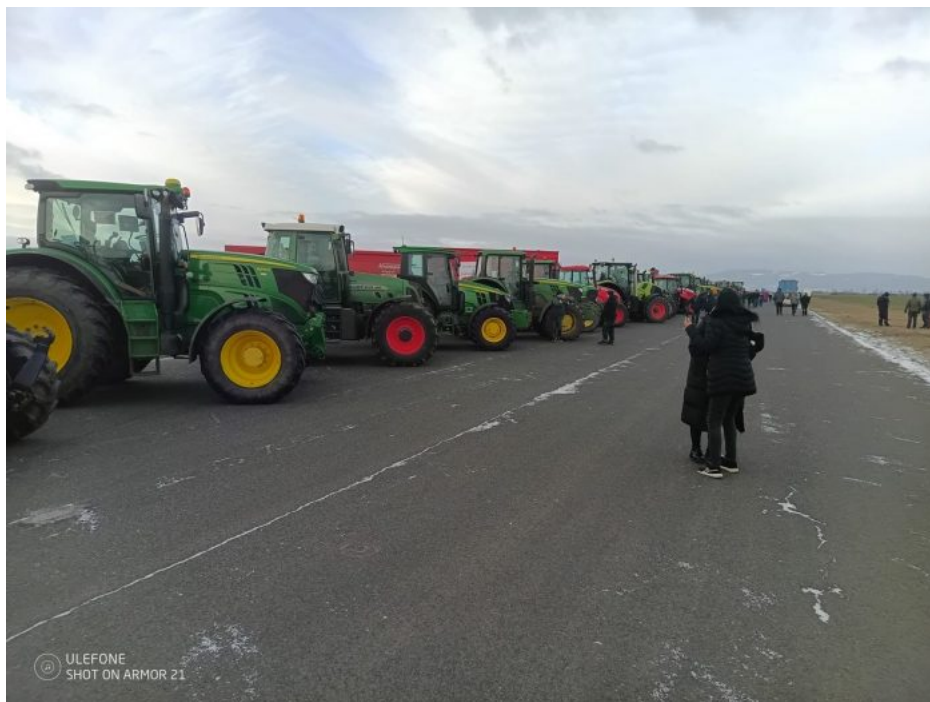
Protest českých zemědělců v Chomutově.

Ten bude navázaný na digitální měny CBDC a na Sociální kredit obyvatelstva. UBI bude vypláceno digitálně, s určenou dobou expirace peněžních CBDC prostředků a s omezením affinity prostředků, to znamená, že nepůjde s penězi zaplatit něco, co se globalistům líbit nebude, třeba kniha o pěstování potravin na zahradě svépomocí.