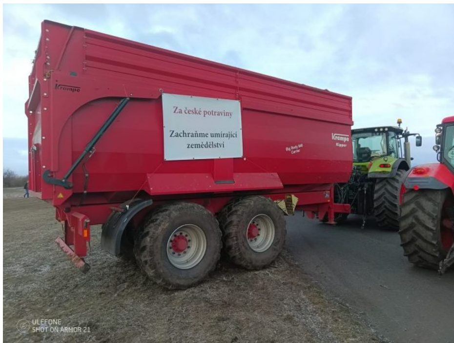
Protest českých zemědělců v Chomutově.

V Německu jde navíc o rušení subvencí a dotačních titulů na kompenzaci vysokých cen energií a paliv v Německu. Tyto kompenzační tituly mají skončit a do čeho se to promítne? Do drastického zvýšení cen potravin, které nemusí zemědělci ekonomicky ustát. Např. mlékárny mají sepsané smlouvy se zemědělci, a když bude mléko příliš drahé, prostě ho neodeberou a nakoupí mléko, no... hádejte, odkud? No přece z Ukrajiny! Ukrajina je totiž ve skutečnosti globalistická puma hromadného ničení, která má za cíl zničit evropské zemědělce. Nejprve ty polské a německé, ale potom i ty české a další. Jakmile evropští zemědělci zkrachují, uvalí EU dusíkové daně i na ukrajinskou produkci a bude vymalováno.