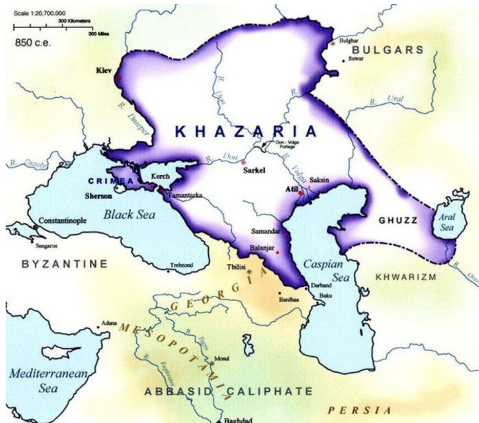
Chazarská říše v polovině 9. století v době největšího rozmachu

Ukrajina je země, která se rozkládá na území bývalé Chazarské říše, po které Ukrajina v roce 1991 převzala státní znak tzv. Chazarské vidlice, což je symbol k zemi letícího sokola při střemhlavém útoku na kořist. Chazarští bojovníci měli dlouhé vlasy svázané na temeni hlavu do culíku, resp. do střípce, kterému s ukrajinštině říká "Chochol" ve smyslu chocholky. Co je zajímavé, to je osud Chazarů po rozpadu jejich říše ve druhé polovině 10. století