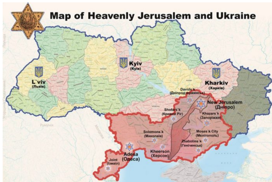
Na severu chazarská Otčina, na jihu Nebeský Jeruzalém

Nejedná se totiž o ochranu svobod nějakých Ukrajinců, na které v podstatě ze strany západu nikdo ani neštěkne. Západní elity totiž zjevně usilují o navrácení Chazarie do rukou dědiců po Chazarské říši. A dokud existovalo silné ruské mocnářství a car, tak to nešlo. Dokud existoval Sovětský svaz, tak to nešlo. Ale jakmile přišel do Kremlu Vladimir Putin dosazený Lvem Levievem, tak nastala příležitost, a proto v roce 2014 byl Američany spuštěn Majdan v Kyjevě a potom 8 let trvající provokování ruského medvěda, aby vylezl z brlohu a zaútočil na Ukrajinu. A potom divná Speciální vojenská operace. A podivné likvidování a odstraňování všech ruských vlastenců, kteří by chtěli obsadit sever Ukrajiny, tedy Otčinu.