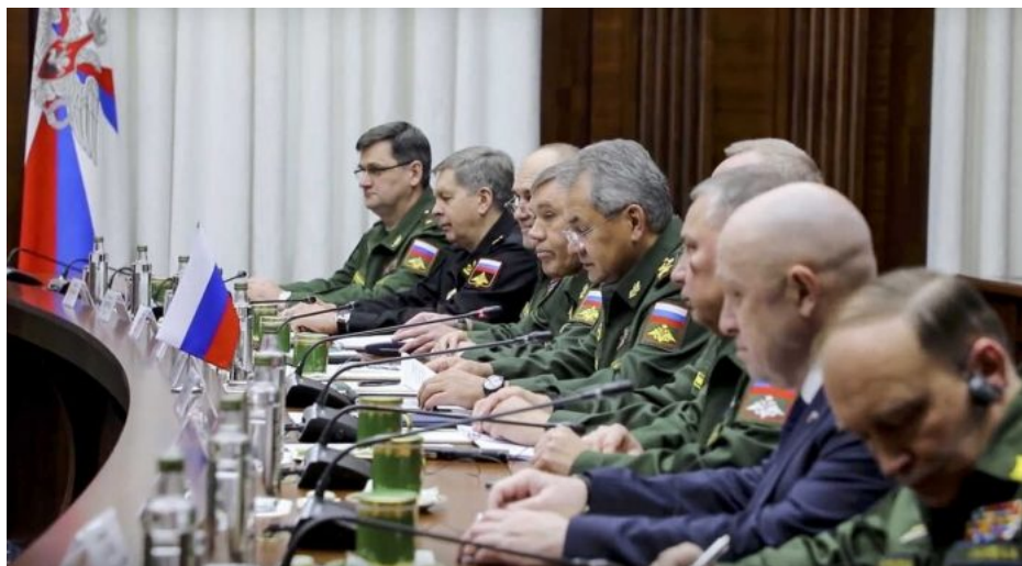
Fotografie z roku 2022, kdy Jevgenij Prigožin zasedal v generálním štábu Ruské armády jako předák jednoho z bojových těles ozbrojených sil

Pokud je tohle plán, tak se lecos vysvětluje. Vysvětluje se, proč ruská SVO je taková divná a Ruská armáda nemá dovoleno se nikam prakticky pohnout. A když se někdo pohne, jako třeba Prigožin vloni s Wagnerovci v Bachmutu, okamžitě mu generálové začnou krátit munici a hází mu klacky pod nohy, aby zastavili postup jeho žoldáků. Všem to bylo divné, proč se to dělo. Ale pokud je cílem návrat Ukrajiny do rukou Chazarů, jejich potomků, potom se tím vše vysvětluje. Není Rusům dovoleno!