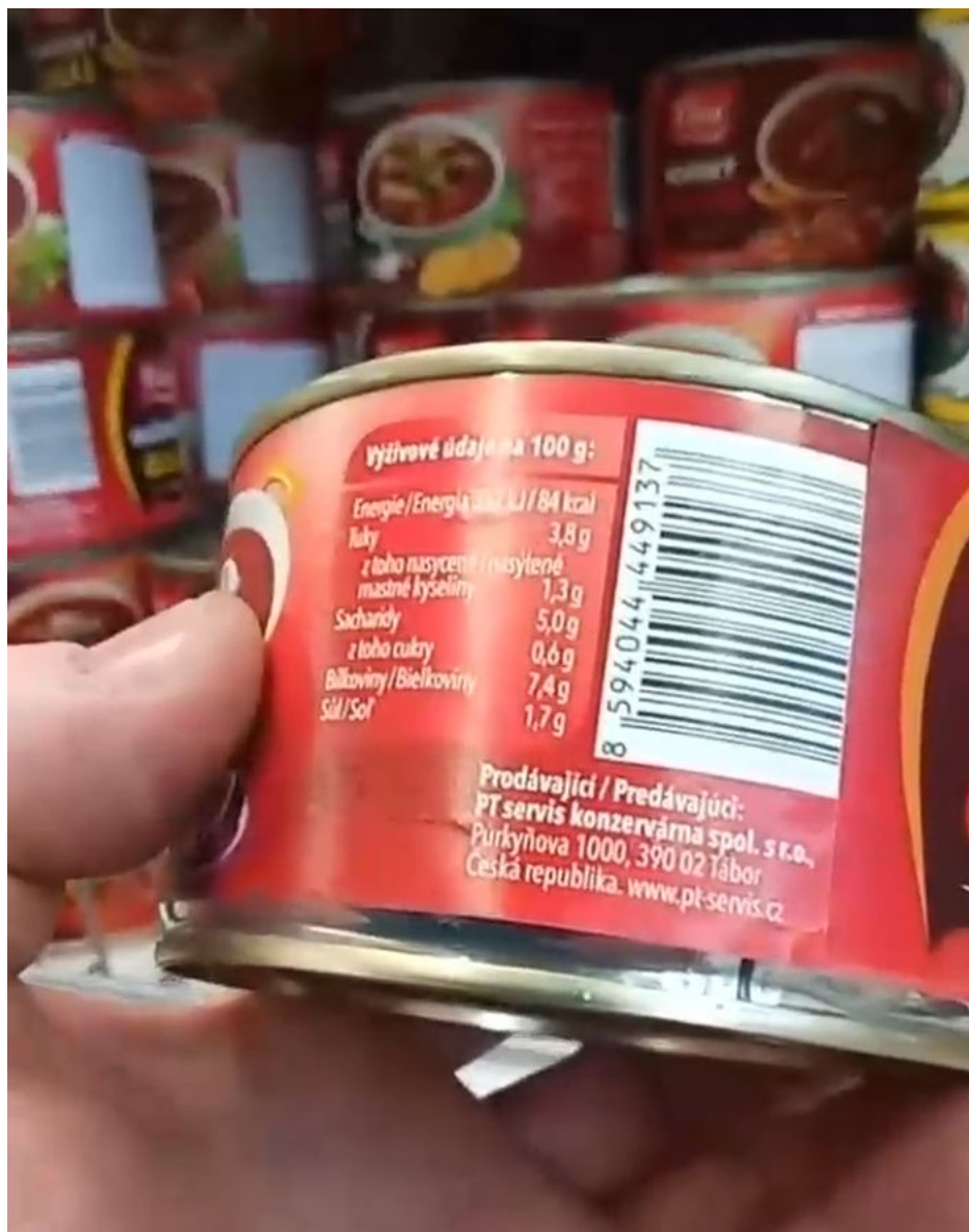
Koňský guláš z Tábora z české humanitární pomoci v ukrajinském supermarketu

Dodnes neexistuje žádné zpětně vyúčtování od Ukrajiny, kolik lidí dostalo humanitární pomoc, kam všude byla rozdělena, jestli šla na pomoci civilistům anebo vojákům. Když teď najednou vidíte, že v Oděse se prodávají české koňské guláše a vepřové konzervy ve vlastní šňávě jako zboží, přestože ty konzervy měly skončit v ukrajinských rodinách jako humanitární pomoc, tak pouze máte důkaz, že s českou humanitární pomocí se prostě na Ukrajině kšeftuje za peníze tupých dárců z Evropy.