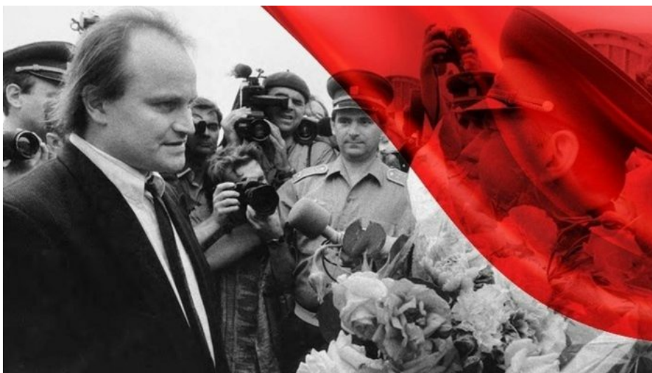
Michael Kocáb pojedie na koncert do Kyjeva

Tato legenda nesmí být zapomenuta, a proto přijede Ukrajincům promluvit do duše, aby se vzbudili. Doufám, že jste pochopili moji ironii a sarkasmus, protože každému je jasné, že v Kyjevě válka není a občasné letecké poplachy prostě za válku nelze považovat, snad pouze za její připomínku, že válka na Ukrajině stále je, tam daleko za Dněprem, tam na Donbasu, v Záporoží a v Chersonu.