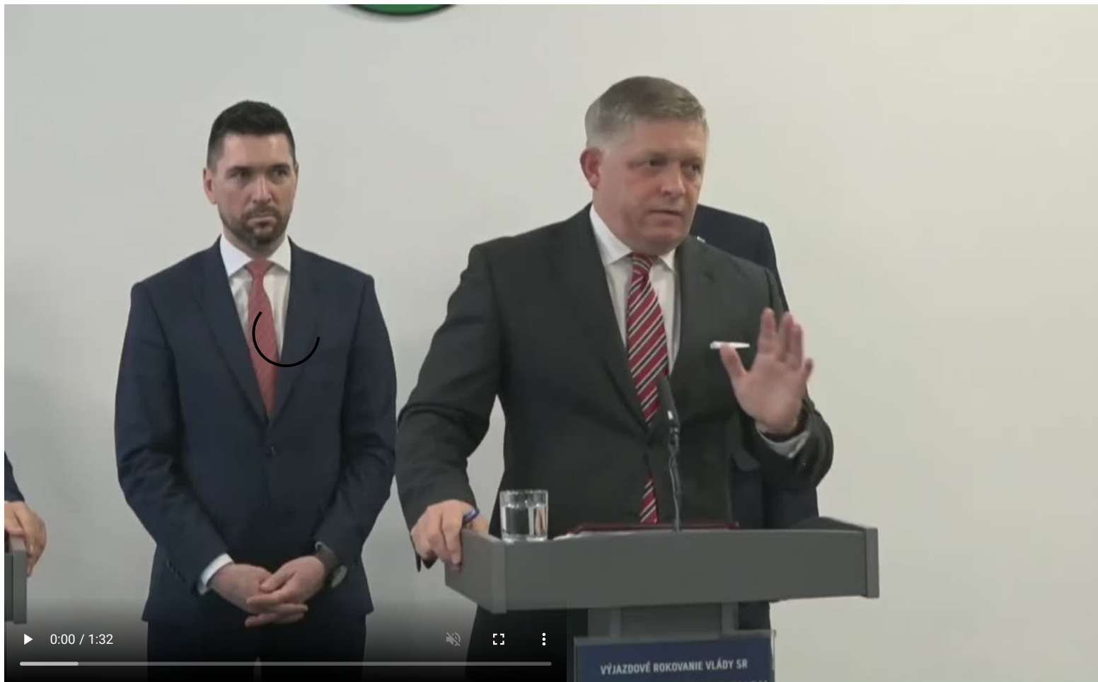
Robert Fico se dostal do sporu s novinářem, jestli je v Kyjevě válka!

Ukrajinská státní agentura na podporu cestovního ruchu spustila webovou stránku [3], která podporuje turisty z domova i ze světa k návštěvě tzv. "bezpečných" měst na Ukrajině, kde je normální život a cizinci v nich mohou utrácet své peníze bez obav z války. Hádejte, jaké město, kromě jiných, je v nabídce? Za pouhých 224 EUR si můžete koupit prohlídku Kyjeva s průvodcem po místních památkách. A pokud by vám to bylo málo, tak za dalších 119 EUR vás průvodce vezme okolo celého Kyjeva po památkách v blízkém okolí Kyjeva.