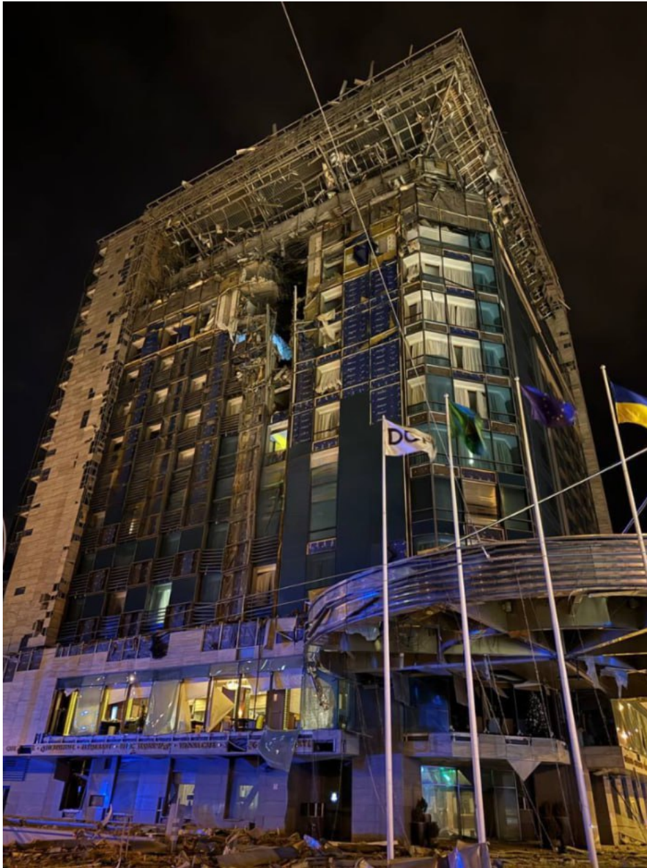
Následky útoku ruské rakety na hotel Charkov Palace, ve kterém byli ubytováni ukrajinští vojáci a poradci NATO

Prostě objekty jako jsou právě hotely, ale také školy v době třeba letních prázdnin, kdy školy i minulý rok během léta používala ukrajinská armáda. Před Rusy nelze tato tajná ubytování vojáků v civilních objektech utajit, protože Rusové mají na Ukrajině miliony informátorů, kteří pohotově informují ruské úřady o pohybu ukrajinských vojsk a o přesunech AFU.