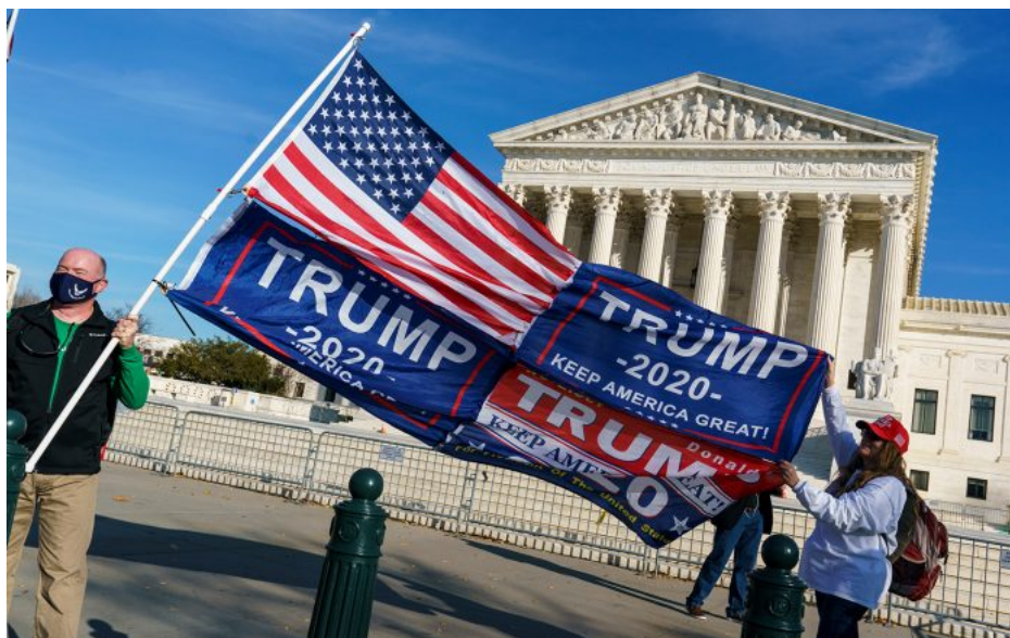
Volby v roce 2020 byly pilotním projektem na preskripci voleb. Na hlasech Američanů už nezáleželo

Když ale v roce 2020 byly pod záminkou virové pandemie poprvé v americké volbě prezidenta spuštěny masové korespondenční volby, byl z toho triumf médií dopředu a preskripčně určeného kandidáta Joea Bidena. Bylo to zajištěno pomocí statisíců korespondenčních hlasů přivážených v kamionech po celých USA v noci ze 4. na 5. listopadu 2020. Z poštovních pytlů se hrnuly 100% volebních lístků jen a jen pro Bidena. Ani jeden lístek pro Trumpa. Pilotní model proběhl hladce, ani jeden z amerických soudů tento proces nezastavil, soudy jednaly v koluzi s elitami, které takto rozhodly, že prezidentem nesmí být Trump. A jedině, co k tomu bylo potřeba, byly masové počty korespondenčních hlasů bůhví odkud.