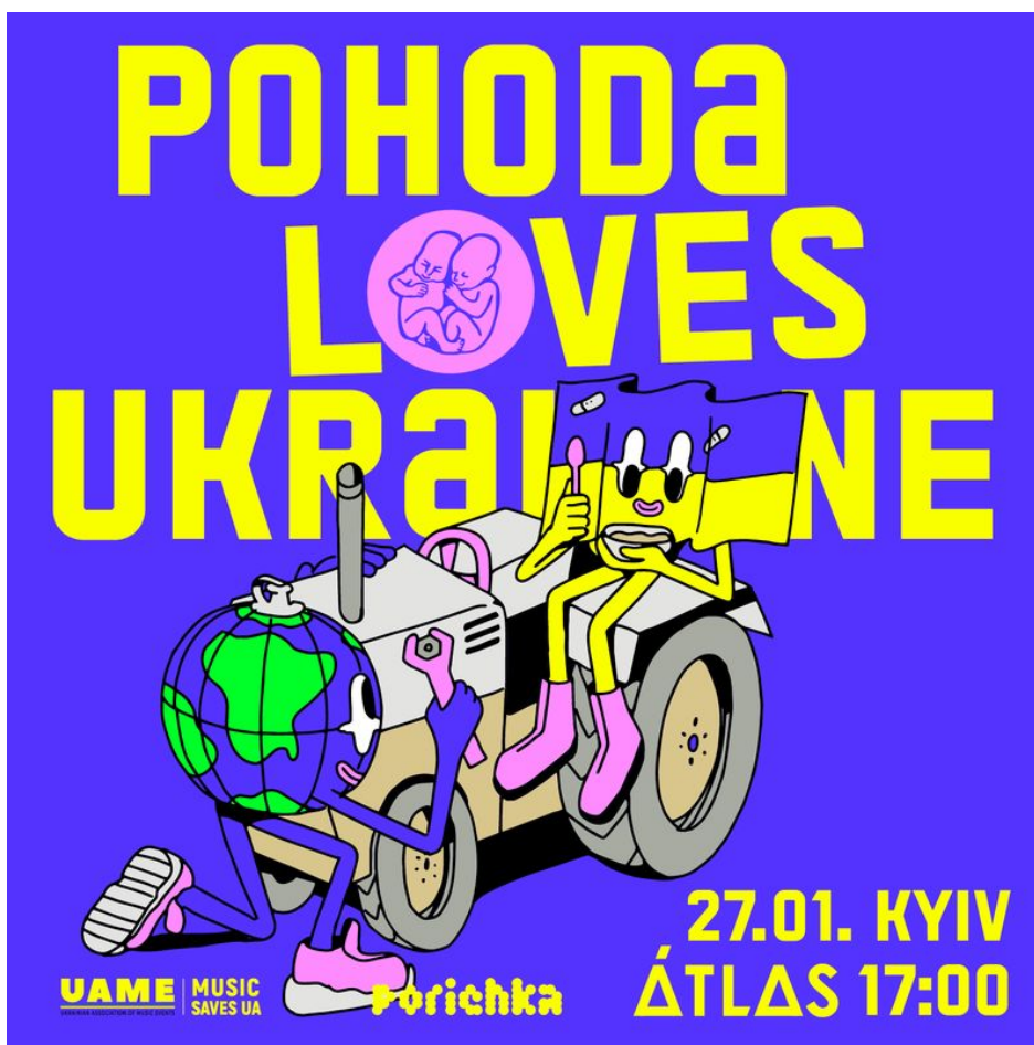
Logotyp festivalu v Kyjevě

Obvinít Fica z navádění ruských raket na festival v Kyjevě je největší perla české rusofobie roku 2024 , protože tohle zatím nenapadlo ani Fialu, ani Černochovou a ani Lipavského. Jenom Domču Haška to bude mrzet, že s tím nepřišel první. Znovu se ukazuje, proč je tak důležité, aby Ficova vláda přijala na Slovensku zákonnou úpravu amerického zákona FARA na registraci tzv. zahraničních agentů , kdy veškeré subjekty ve státě, které přijímají finanční, hmotné nebo lidské prostředky pro šíření agendy zahraniční mocnosti, zahraniční organizace nebo zahraničního subjektu, se musí oficiálně registrovat jako agent zahraniční moci.