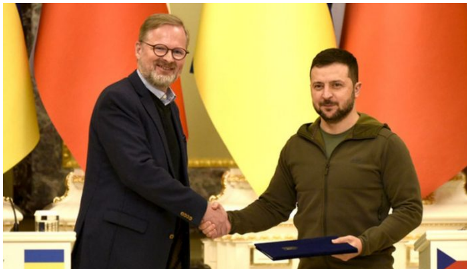
Tihle dva skončí brzy krátce po sobě

Podle ukrajinských zdrojů se už objevily uvnitř ukrajinské armády a mezi oligarchy na Ukrajině silné hlasy, aby Zelenský rezignoval na svoji funkci ke konci ledna. Jeho pozice je již neudržitelná. Nová mobilizace 500 000 lidí je u ledu a sám Zelenský o víkendu couvl [2], že Ukrajina tyto muže zatím nepotřebuje. Je to samozřejmě ústupový manévr Zelenského, tlaky na jeho odchod budou v následujících dnech mohutně sílit. Zelená zrůda s sebou strhne i řadu evropských politiků, možná dojde i na kolaps Fialenkovy vlády v Praze, ve které se objevují první trhliny a praskliny [3]. Stánkaři to balí, šeptá se v kuloárech. Zima bude tuhá v politice. A jaké bude Pražské jaro, Péťo? Těš se, my už to víme!