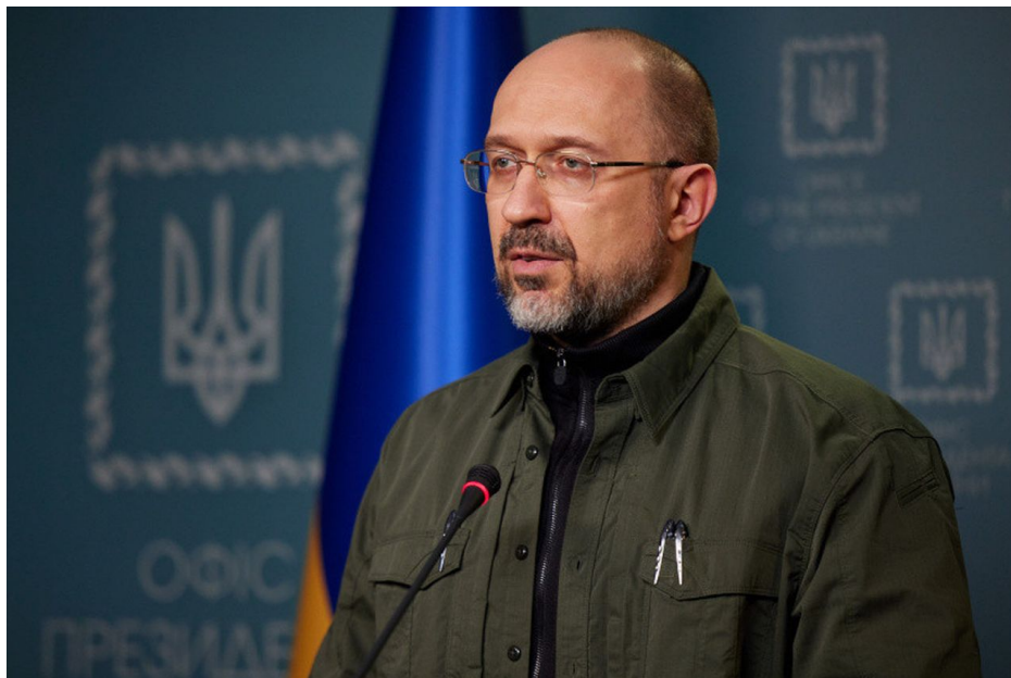
Denys Šmyhal, premiér Ukrajiny

Tyto výhrůžky padají pravidelně na banderovských telegramových kanálech i na Donalda Trumpa, Tuckera Carlsona a další americké komentátory a politiky, ovšem ti samozřejmě na Ukrajinu nejezdí a nemají v plánu, že by tam jeli. Ficovo sobotní prohlášení, že Slovensko zablokuje vstup Ukrajiny do NATO, bylo na ukrajinských Bandera sítích komentováno velmi ostře a i v naší redakci považujeme cestu Roberta Fica na Ukrajinu za potenciálně vysoce rizikovou a nebezpečnou.